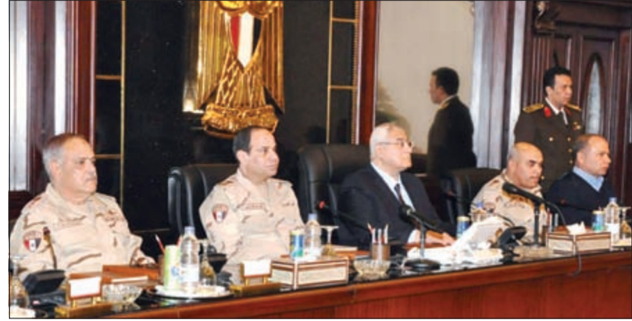
جانب من اجتماع المجلس الأعلى للقوات المسلحة بحضور الرئيس المصري عدلي منصور مساء أمس

وحصل السيبي على عدد من الميداليات والأنواط العسكرية نظراً لجهوده في مكافحة الإرهاب. وجاء إعلان السيبي استقالته وترشحه للرئاسة عقب اجتماع مفاجئ للمجلس الأعلى للقوات المسلحة (أعلى هيئة في الجيش المصري) بحضور الرئيس المؤقت عدلي منصور، وهو الاجتماع الذي استمر قرابة ساعتين ونصف الساعة. وعقب نهاية هذا الاجتماع صدر قرار رئاسي بترقية الفريق صدقي صبحي، رئيس أركان الجيش المصري إلى رتبة فريق أول، وهو ما قد يمهد لتعيينه وزيراً للدفاع خلفاً للسيسي.