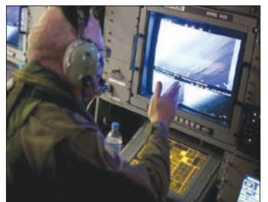
مسح بحري مستمر بحثاً عن الطائرة الماليزية

وكان رئيس الوزراء الماليزي نجيب رزاق أعلن الإثنين الماضي أن الطائرة المفقودة سقطت في المحيط الهندي، فيما أبلغت الخطوط الجوية الماليزية عائلات الركاب أنه لا يوجد أي ناجين من بين الذين كانوا على متنها. يذكر أن الاتصال كان فقد مع الطائرة وعلى متنها 239 شخصاً، في 8 الجاري من دون أن يتم العثور عليها.