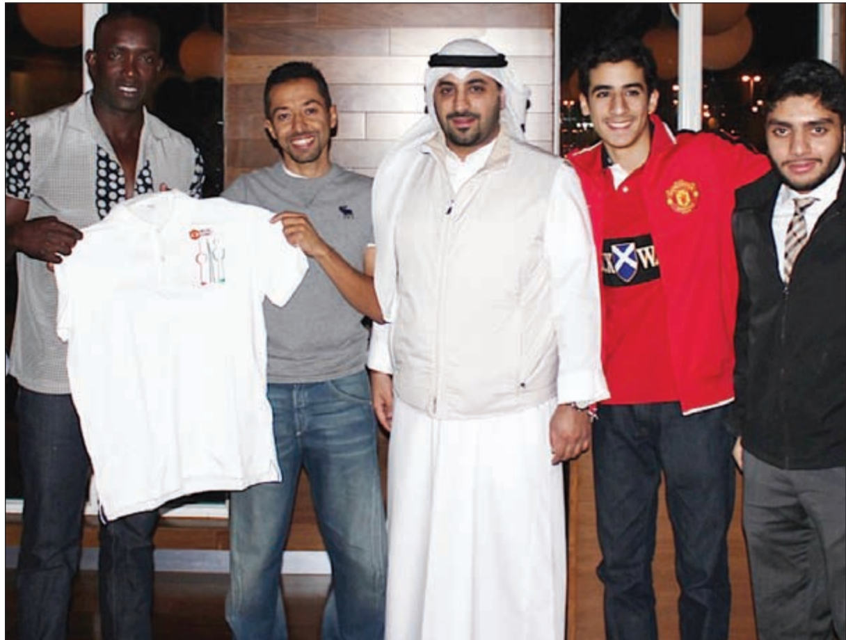
الحدردان يهدي بورك قميص نادي مشجعي مان يونايتد خلال زيارة سابقة للكويت

الجابر: لن يحقق مان يونايتد ما حققه ليفربول 2005 أو تشلسي 2012.. كنت أتمنى مورينيو أو كلوب لخلافة «فيرغي»