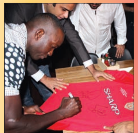
بورك يوقع للمعجبين على قميص مان يونايتد