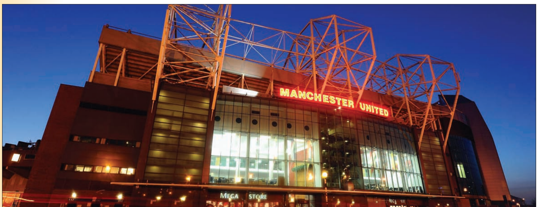
ملعب أولد ترافورد من الخارج

● الحراك: لا أوافق عليه والدليل أنه مع ايفرتون وطلبة 11 عاماً لم يحقق أي بطولة، فمويس يصلح لفرق الوسط أو الصغيرة فهو غير مؤهل لقيادة نادي بحجم مان من تخطيط وإفلاس كروي؟! ● الشثيل: أتفق مع الحدردان، فوجب إعطاء مويس الوقت الكافي، فهو عندما كان مدرباً لك «توفيز»، وحصل على جائزة أفضل مدرب ثلاث مرات، كما أنه حصل على أعلى نسبة تصويت ليكون بذلك خليفة السير سنة 2006. ● الجابر: لا أختلف مع الحدردان والشتيل بسبب تزكية فيرغسون له، لكن كمشجع وعاشق للفريق كنت أتمناه الشخص الثالث بعد مورينيو وكلوب، فإلى جانب تخطيطه في التشكيلة فقد عانى من إصابات اللاعبين وهبوط مستوى البعض منهم. ترقعاتكم لمسيرة الفريق هذا الموسم؟