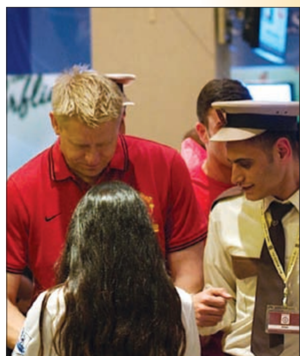
العلاق شمايكل خلال زيارته للكويت