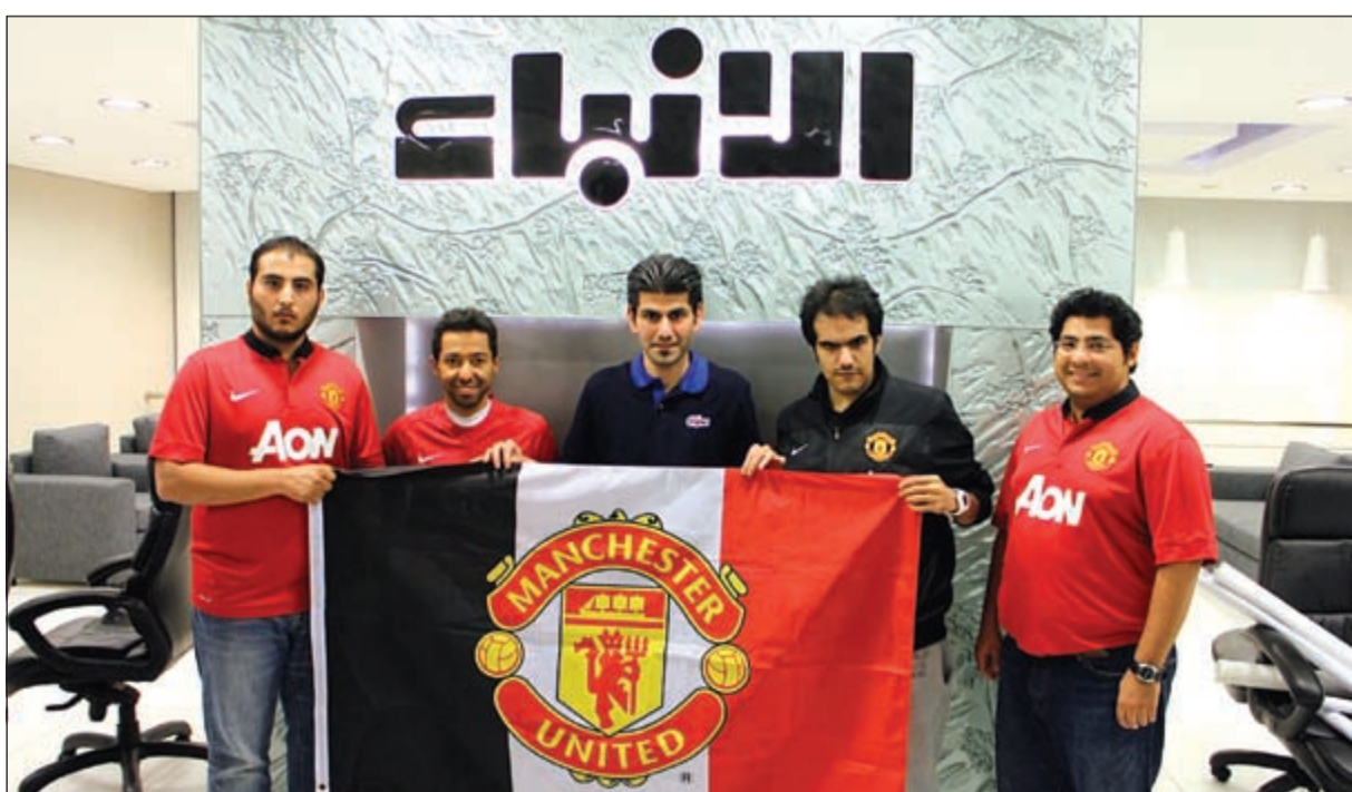
لقطة تذكارية مع علم نادي مان يونايتد

وقد قامت «الأنباء» باستضافة أعضاء نادي مشجعي مان يونايتد المعترف به من النادي في إنجلترا وذلك لتسليط الضوء على أبرز ما يمر ويمر به الشياطين حاليا، وللتعرف على آرائهم لكي يستعيد الزعيم مكانته.