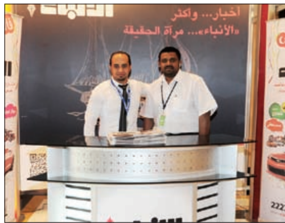
جناح «الانباء» في المعرض