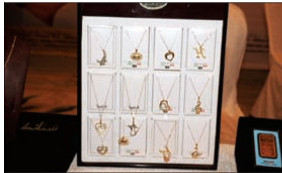
مشغولات ذهبية (قاسم باشا)