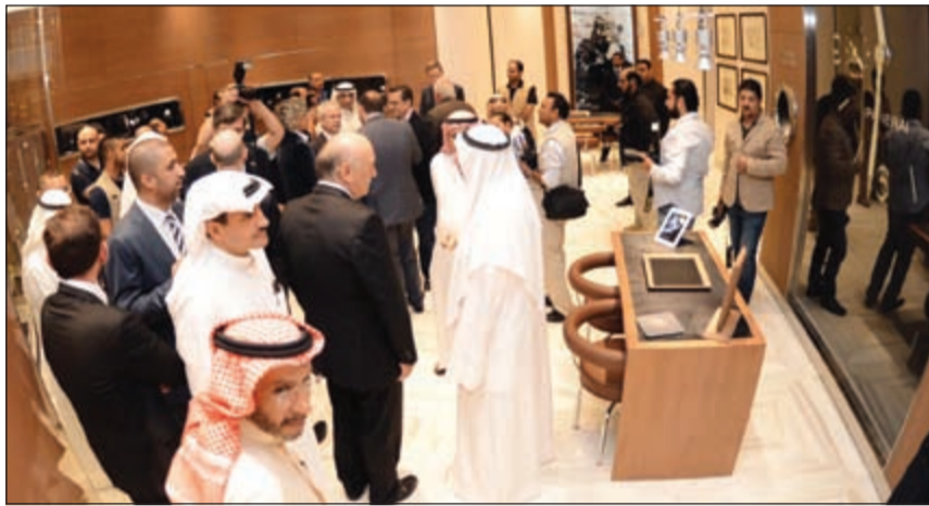
جولة داخل المتجر

2014، سوف يصبح لدينا 13 متجراً في مختلف أنحاء المنطقة. ويأتي افتتاح المتجر في الكويت بمنزلة تطور تراث طويل الأمد يمتد لأكثر من 150 عاماً، تميزت خلاله الشركة الفلورنسية في مجال صناعة الساعات، كما يؤكد على موقع الشركة في المنطقة لاسيما أنها تملك 3 متاجر في الإمارات العربية المتحدة، متجراً في بيروت، متجراً في قطر، متجراً في عمان، 3 متاجر في المملكة العربية السعودية، متجراً في إسطنبول، متجراً في مومباي وقرباً في البحرين.