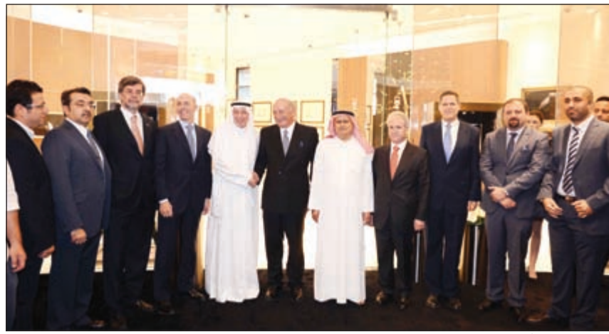
علي بهبهاني وأحمد بهبهاني وأنجلو بوناتي والسفير الأميركي ماثيو تولر ومجموعة من الحضور