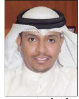
عبد العزيز السمحان

مجموعات وأطياف واسعة من المجتمع الكويتي الرغبة الكبيرة في قيام الدولة بدور أوسع في دعم مشاريعهم وتمويلها وتحويلها إلى حقيقة على أرض الواقع، مبينا أن الشباب هم الأساس الذي يعول عليه في نهضة الأمة وأفكارهم ومشاريعهم يجب أن تلقى آثانا مصغية وأموالا داعمة، وهو ما أكد عليه أكثر من مرة صاحب السمو الأمير الشيخ صباح الأحمد. ورأى أن جميع المبادرات التي قامت بها الحكومة خلال السنوات السابقة لم ترق حتى اللحظة إلى مستوى التحديات المعاصرة ولم تصل إلى مختلف شرائح المجتمع ولم تحقق رغبات الشباب