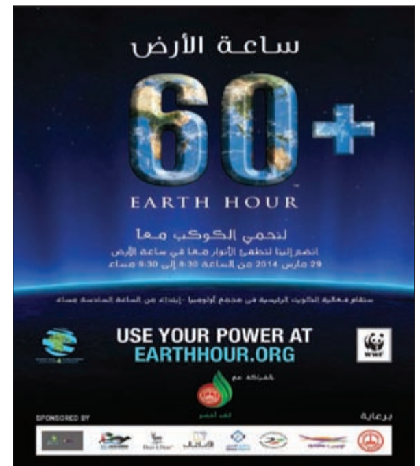
شعار ساعة الأرض