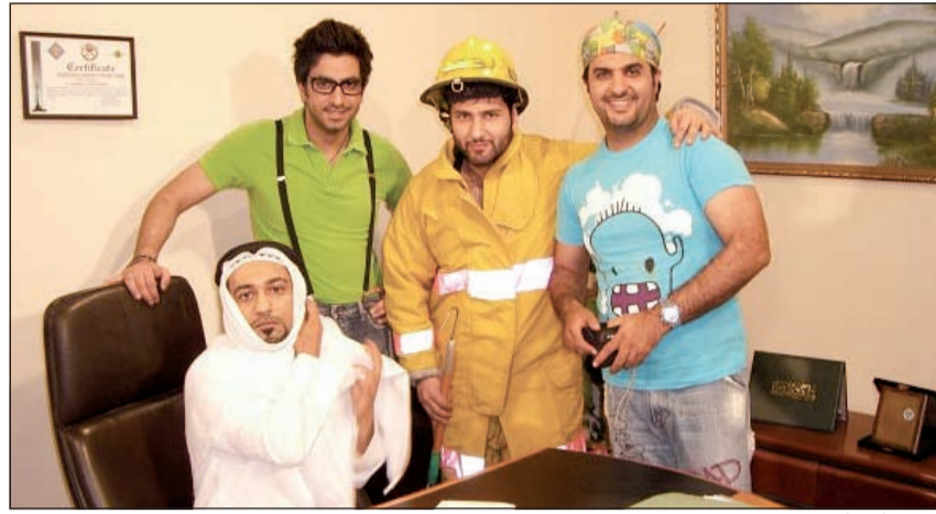
.. وفي أحد أعماله الفنية