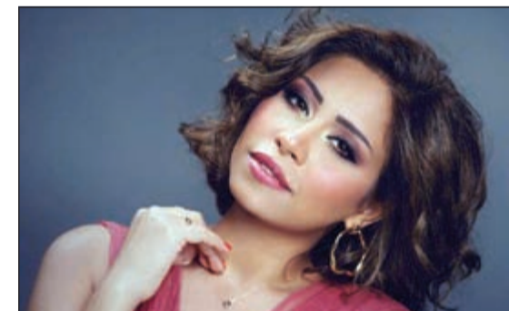
شيرين عبد الوهاب

بعد الحرب الإعلامية التي شهدتها الجمهور بين الفنانة هيفاء وهبي وإيسا، صرحت أصالة بأنها ضد هيفاء، فائتساء اللقاء الذي جمع شيرين عبد الوهاب وأصالة إلى جانب الإعلامي طوني خليفة في برنامج «صولا»، جرى التطرق إلى صوت هيفاء وطريقة أدائها الغنائي، بأسلوب نقدي أقرب إلى السخرية، وخاصة من أصالة. وقد تعمد خليفة سؤال أصالة عن سبب تغيير دفة الحديث كلما ذكر اسم هيفاء، فتدخلت شيرين بالقول: «هيفاء شخص دؤوب، يود النجاح،