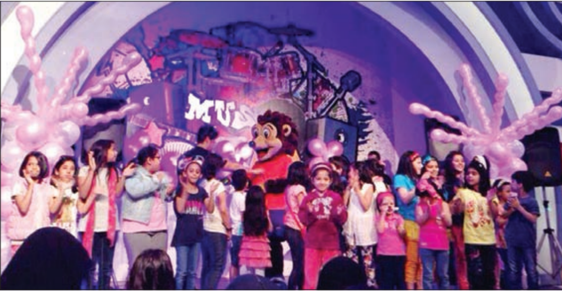
مشاركة جماعية من الأطفال

بمناسبة يوم الأم، وتكريما للأمهات، نظم مركز الترفيه العائلي «إنفانتي» في مول 360 احتفالية مميزة بمشاركة وتقديم المذيع الشاب والشهير محمد الشعبي وبحضور حشد كبير من الأمهات والأطفال. وتخلل الاحتفال الذي أقيم بمناسبة يوم الأم، العديد من الأنشطة والبرامج