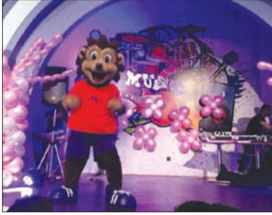
جانب من الحفل

في الاحتفالية أيضا بانشطة عدة منها الرسم على الوجوه، وتم في نهاية الحفل توزيع الزهور على الأمهات. يحرص مركز «إنفانتي» دائما على مشاركة جميع افراد العائلة المناسبات المميزة وذلك إيمانًا منه بأهمية دوره في المشاركة في هذه المناسبات الاجتماعية والترفيهية.