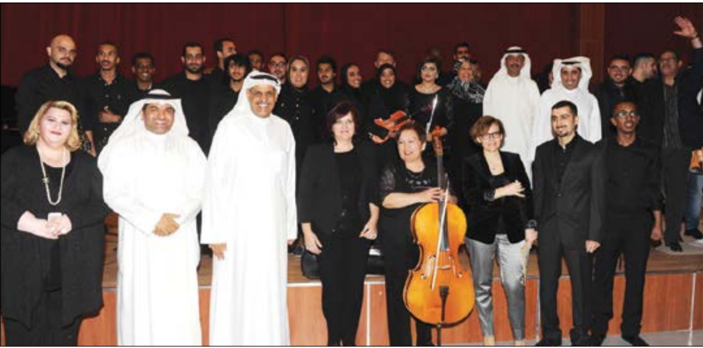
مدرسو معهد الموسيقى مع طلبتهم وصورة تذكارية أثناء الحفل