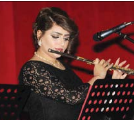
.. وعزف موسيقي متميز لاحدى الطالبات