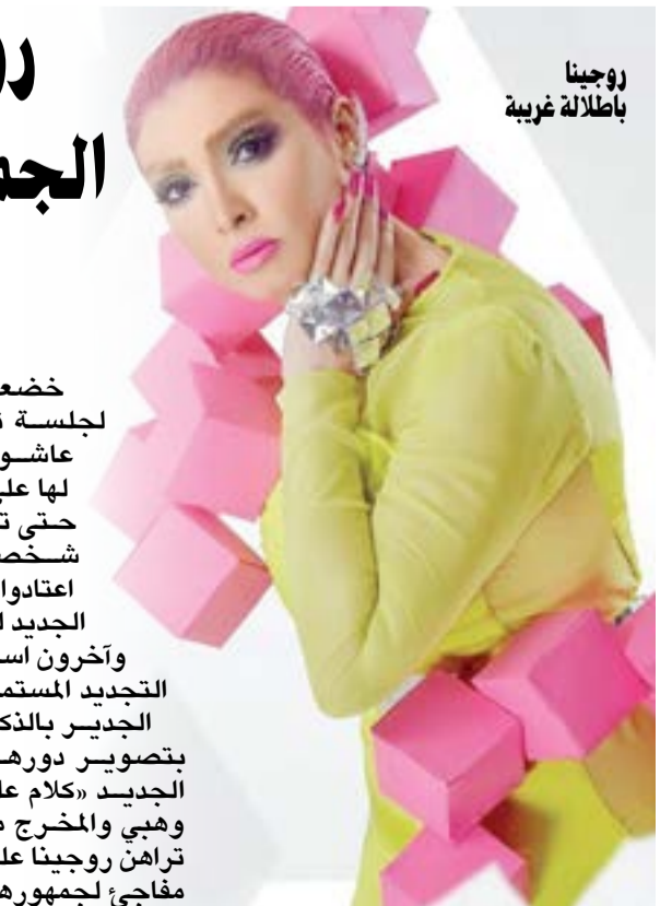
روجينا باطلالة غريبة

خضعت الممثلة المصرية روجينا لجلسة تصوير مع المصور محمود عاشور، الذي اعتمد في تصويره لها على عمل تغيير كامل لروجينا حتى تبدو في هذه الجلسة وكأنها شخصية مختلفة تماماً عن التي اعتادوا عليها. وفوجئ الجمهور باللوك الجديد لروجينا وبعضهم لم يعجبه، وآخرون استحسنوه واكدوا أنهم يفضلون التجديد المستمر لنجمتهم. الجدير بالذكر أن روجينا مشغولة حالياً بتصوير دورها في المسلسل التلفزيوني الجديد «كلام على ورق» مع الفنانة هيفاء وهبي والمخرج محمد سامي في بيروت، حيث تراهن روجينا على هذا الدور الذي يقدمها بشكل مفاجئ لجمهورها.