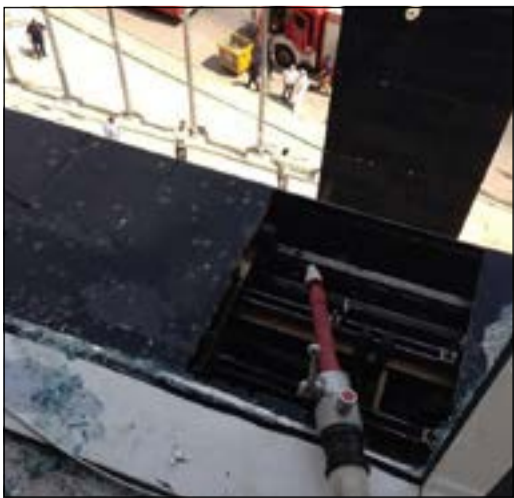
الليم قد يكون سببا في حريق البناية