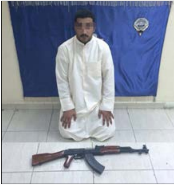
المتهم وامامه السلاح المستخدم

جهودها لضبط الأسلحة والذخائر غير المرخصة والاستعمال المخالف للقانون وضبط وملاحقة المتهمين المطلوبين.