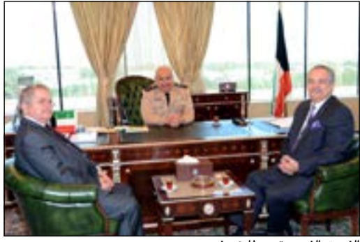
الفريق الفهد متوسطا ضيفيه