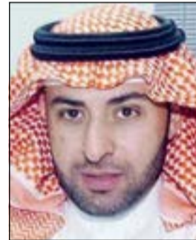
المقدم الشيخ عبدالله المالك

أحال رجال مباحث المطار بقيادة المقدم الشيخ عبدالله المالك يوم أمس الأول 3 اشخاص إلى الإدارة العامة لمكافحة المخدرات بواقع وافدة لبنانية قدمت من وطنها وبحوزتها 300 حبة مخدرة، ومواطن وسيدة تبين انهما يقومان بتدخين الحشيش داخل مقهى في المطار، ويجسب مصدر امني فيان رجال مباحث