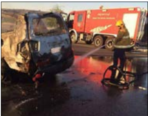
أحد رجال الإطفاء يتعامل مع الحادث المروري