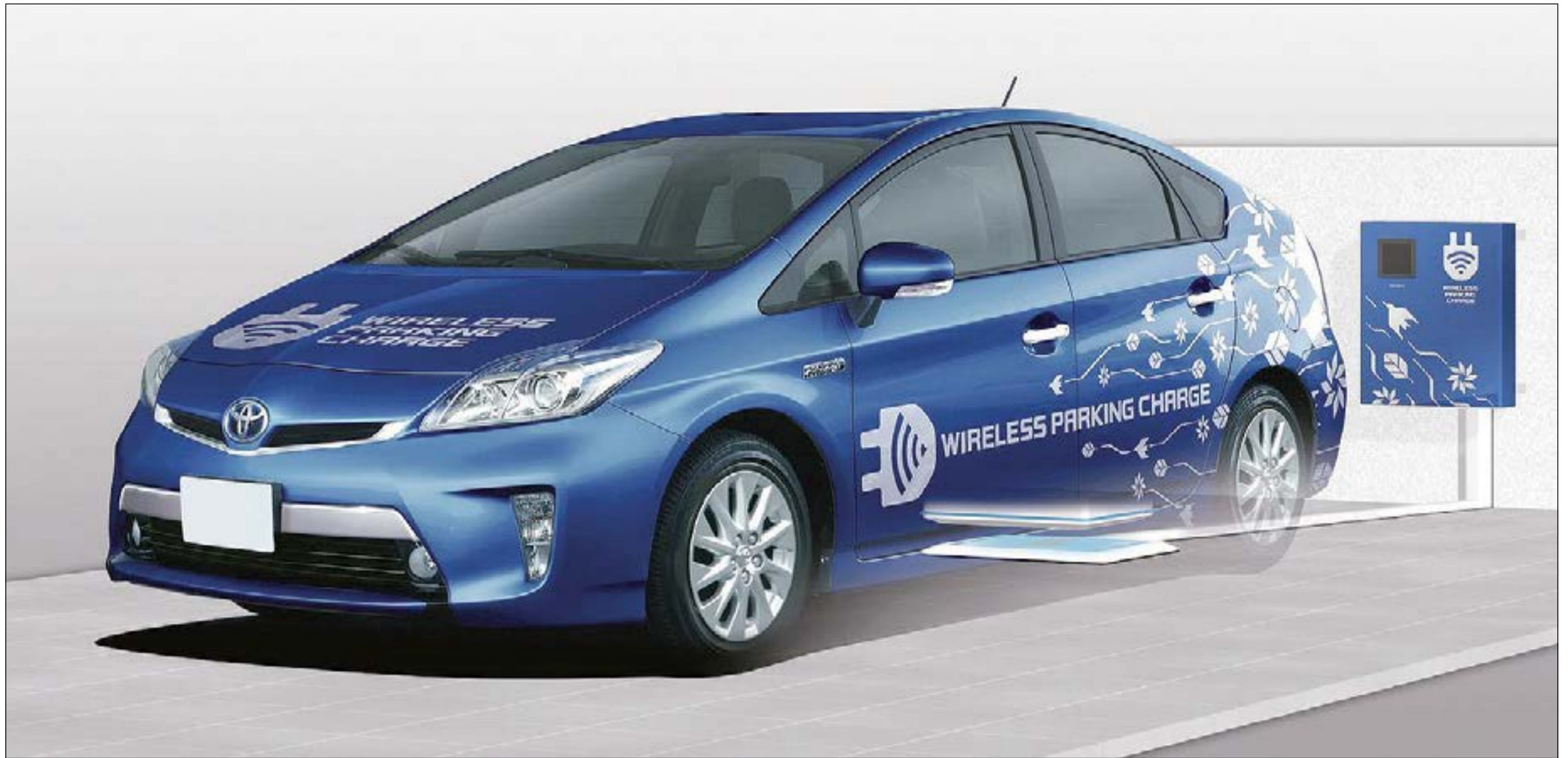
تويوتا، على رأس الشركات العالمية في الاستخدام الأمثل للطاقة الكهربائية