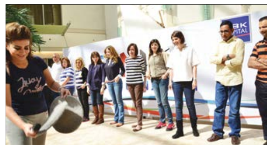
جانب من اليوم المفتوح لموظفي الشركة

من النشاطات الترفيهية والهادفة للأطفال مثل الرسم على الوجوه وتشكيل العجين والكراسي الموسيقية، في حين استمتع بعض المشاركين بالأنشطة الرياضية المختلفة في المرافق الخارجية للفندق. تقيم شركة الوطني للاستثمار NBK Capital هذا الحدث السنوي لتعزيز ثقافة المشاركة التفاعلية بين جميع أفراد أسرة الشركة والمبنية على مبادئ التواصل البناء مع الموظفين وتمكينهم.