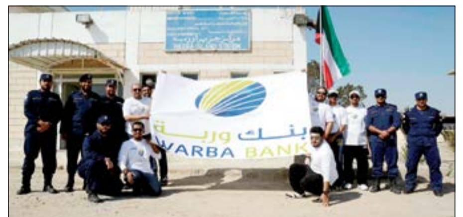
فريق عمل بنك وربة مع الإدارة العمة لخير السواحل

ضمن إطار الفعاليات المجتمعية التي يحرص بنك وربة على تنظيمها تأكيدا لمسؤوليته في الحفاظ على البيئة، نظم الفريق الشبابي التطوعي في البنك زيارة ميدانية إلى جزيرة وربة فيها موظفو المجموعة المصرفية في بنك وربة، والذين قاموا بحملة تنظيف للجزيرة، تخللتها زراعة عدد من الأشجار، بهدف المحافظة على البيئة وحماية معالم الكويت الطبيعية من التلوث. تاتي هذه الجولة الميدانية لجزيرة وربة من ضمن فعاليات الفريق الشبابي التطوعي من مركز الاتصال في بنك وربة ويهدف إلى تعزيز