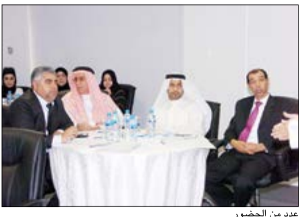
عدد من الحضور

وقال: تتعاقد بعض الشركات الخاصة بالنظافة مع البلدية وفق بنود مبرمة ولوائح وقوانين ضمن مناقصة يتم طرحها من قبل اللجنة التابعة للبلدية وتكون خلال مدة زمنية محددة يتم وضعها مع الشروط التي تضمنها العقد، وتلك الشركات تكون مسؤولة عن نظافة مناطق موزعة على حسب المحافظات التابعة لمحافظة العاصمة فهي 13 عقدا. وبين السليبات والإيجابيات في العقود الحالية، حيث أوضح للمواطنين والمقيمين بشأن التعامل مع النفائيات. ● وضع جدول عمل مناسب للأليات بحيث لا يتعارض مع وقت منع المرور واستيفائها لساعات عملها حتى يتم العمل بكامل وجهه. ● زيادة عدد الكباسات، وذلك بسبب زيادة بناء الشقق مما أدى إلى الكثافة السكانية في بعض المناطق. ● وضع جدول مناسب لعمل الآليات خلال فصلي الشتاء وال الصيف. ● استخدام عمالة من بيئة ذات مستوى تعليمي. ● التوجه إلى تطبيق عقود النتيجة. ● وضع شعارات بيئية على جميع الآليات والمعدات تحت على النظافة.