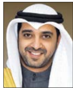
الشيخ محمد العبدالله

أكد وزير الدولة لشؤون مجلس الوزراء ورئيس اللجنة التنسيقية العليا للمؤتمرات الشيخ محمد العبدالله أن اللجنة أنهت كل الاستعدادات والتخصيصات لاستضافة الكويت اجتماع مجلس جامعة الدول العربية على مستوى القمة للدورة الـ 25 التي ستعقد في الكويت.