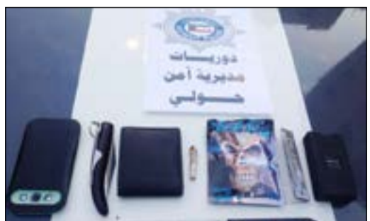
المضبوطات لحياتى إلى «المكافحة».