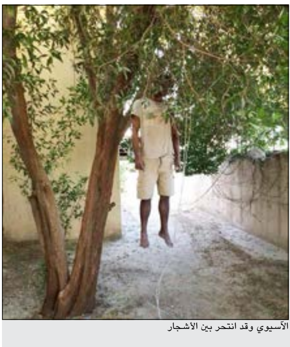
الأسوي وقد انتحر بين الأشجار

للقوقوف على هوية الجاني تمهيدا لضبطه واحالته الى الاختصاص. من جهة أخرى، ألقى رجال الإدارة العامة للمباحث الجنائية القبض على شخصين أحدهما من غير محددى الجنسية والآخر بريطاني، وذلك بعد ورود معلومات عن سطو مسلح «على بقالة