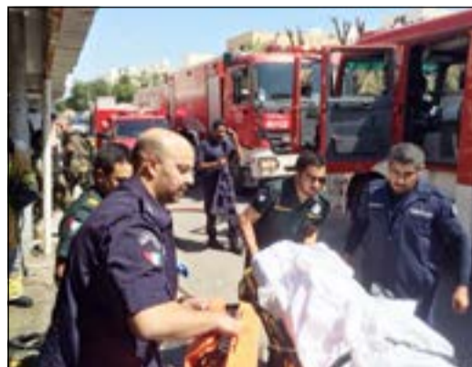
رجال الإطفاء يساعدون في نقل السيدة إلى العلاج