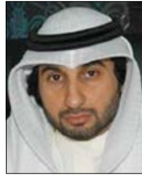
القاضي فارس الفهد