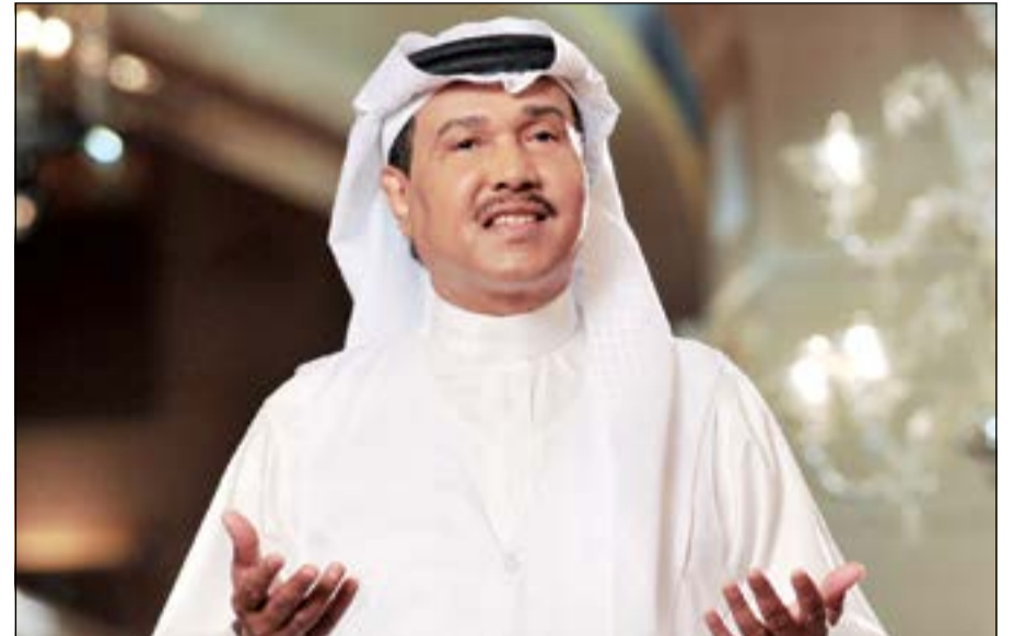
فنان العرب محمد عبده

حضرت قبل الحفل لتتابع أبو نورة، ولكنه عندما أنهى وصلته الأولى، وشاهدنا بين الحضور نكتي حياها بيديه مع ابتسامة رصدها الجميع. نكر موقع «سيدتي نت» أن هذه السيدة السعودية، هي أم لشابين في فرقة عبده. وأكدت بعض مواقع التواصل الاجتماعي أن الفنانة كارمن سليمان ستحضر إلى البحرين للتلقيح خلال الحفلة في مفاجأة للفنان، ولكن كارمن لم تحضر ولم يعرف إذا كان حضورها مقراً فعلاً أم أنها مجرد فبركة إعلامية. إلى ذلك فوجئ الحضور وذلك لعدم وجود خاتم الزواج «الدبلة» في أصبع فنان العرب، وانطلقت التكهنات، فالبيض أكد على أنه كان خلال الفترة الأخيرة يشاهد من وضع خاتم زواج، بينما أشار البعض إلى أنه كان يضع الخاتم بعد زواجه الأخير.