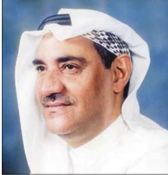
الراحل عبد الحميد السيد

كبيراً في عطاءه لفنه، دمت الأخلاق، هادئاً حتى في رحيله، تشرفت بلقائه مرات عديدة عندما تسلمت قيادة التلفزيون وكانه كان يقول لآل التلفزيون الكويت «بيتي وماوأي»، وقتت له إجلالاً واحتراماً لهذا العملاق الذي عشق الكويتيين رائحته «هيا يارمانه.. الحلوة زعلانه»،