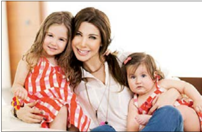
نانسي عجرم مع ابنتيها

ابنتا نانسي عجرم ترؤجان ألبومها.. وجمهورها غاضب من صورتها المثيرة