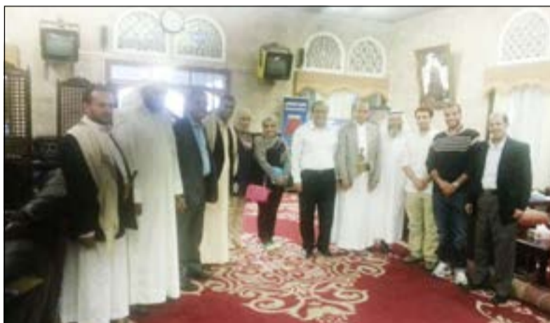
المشاركين في الرحلة التوعوية