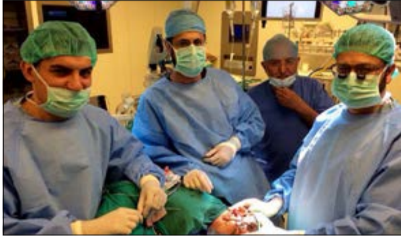
الفريق الكويتي الذي أجرى عملية أول عملية توصيل ميكروسكوبي في البلاد

للجرح التجميلي لشدة الوجه. الغرض منه سهولة إخفاء أثر العملية، لافتاً إلى أن العملية تعالج جميع جوانب شلل الوجه من حركة الفم والجفن والابتسامة في آن واحد دون الحاجة لأي عملية أخرى مستقبلية، مؤكداً أن العملية تعتبر من العمليات النادرة والتي لا يقوم بها إلا بعض المراكز العالمية المتخصصة. بدوره، بين استشاري جراحة المخ والأعصاب في مستشفى ابن سينا