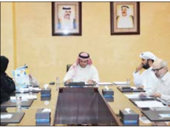
جانبا من الاجتماع