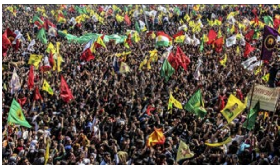
أكراد اترك يرفعون اعلاما وصورا لزعيمهم عبد الله اوجلان احتفالا بعيد النيروز بديار بكر امس

طويلا. وتوقع نائب رئيس الوزراء علي باباجان، امس ان يكون إغلاق موقع تويتر مؤقتا، وأنه يجب التوصل الي اتفاق مع موقع التواصل الاجتماعي. وقد نددت المفوضة الأوروبية المكلفة بالتكنولوجيا الجديدة نبلي كرويس بشدة حظر موقع تويتر للتواصل الاجتماعي في تركيا. وقالت ان «حظر تويتر في تركيا هو بدون أساس وبدون جدوى وجبان». وأضافت ان «الشعب التركي والأسرة الدولية سيعتبران الأمر رقابة وهو كذلك» وقد اختارت ان تدلي بتصريحها على حسابها في تويتر. وقال مفوض توسعة العضوية بالاتحاد الأوروبي ستيفان فولى انه شعر «بقلق بالغ» بسبب منع الدخول الى موقع تويتر في تركيا. وكتب فولى في حسابه على «تويتر» قائلا «ان تكون حرا في التواصل وان تختار بحرية الوسيلة لعمل ذلك شيء أساسي لقيم الاتحاد الأوروبي». وصرح النائب عن حزب الشعب الجمهوري المعارض، عاكف حمزة جيبى لـ «رويترز» بأن الحزب سيقدم طعنا في قرار محكمة بإغلاق الدخول الى موقع تويتر، لافتا إلى ان الحزب سيقدم شكوى ضد أردوغان على أساس انه ينتهك الحريات الشخصية.