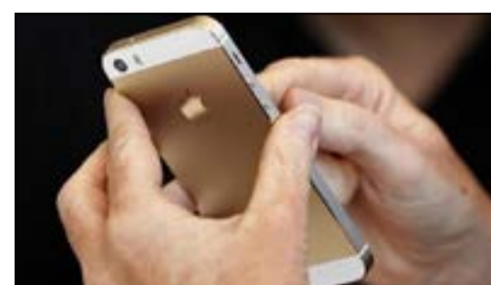
شكل تقريبي لـ «آيفون 6»

هواتف «آيفون 5» و«آيفون 5 إس». كما أنه بالتزامن مع الزيادة في حجم الشاشة فإنها ستتمتع بدقة عالية عند 1080 بيكسل، أي أنها ستكون Full HD. وفي حال صحت هذه التسيريات وجاءت مطابقة لمواصفات هاتف «آيفون» الجديد فهذا يؤكد أن شركة «آبل» الأميركية تحولت إلى اللحاق بمنافستها في كوريا الجنوبية «سامسونغ»، والتي كشفت عن مواصفات هاتف «غالاكسي إس فايف»، حيث سيكون مقاوماً للمياه.