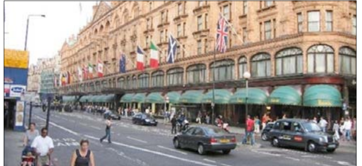
الأثرياء الخليجيون يشترون الهدايا باللايين من «هارودز»

بوابة كأس العالم هكذا يطلق عليها، فاحتفالات كأس العالم في الشوارع والعباب السامبا والفوضى المحيطة باحتفالات بطولة كأس العالم لكرة القدم هذا العام في البرازيل خلال هذا الصيف ستكون مرهقة للجميع، فعندما ينتهي العمل فسيكون الهروب إلى فرناندو دي نورونا التي تبعد 330 ميلاً عن المدن المستضيفة لكأس العالم وتتميز تلك المدينة بالصخور السوداء ذات