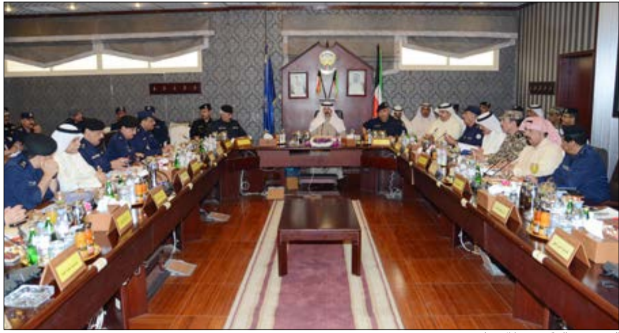
الشيخ محمد الخالد مترسدا الاجتماع

قام نائب رئيس مجلس الوزراء ووزير الداخلية الشيخ محمد الخالد أمس بزيارة غرفة اتخاذ القرار بالإدارة العامة المركزية للعمليات بوزارة الداخلية يرافقه وكيل وزارة الداخلية رئيس اللجنة الأمنية الفريق سليمان الفهد للوقوف على الاستعدادات والإجراءات التي قامت بها اللجنة الأمنية العليا لمؤتمر القمة العربية في دورته الخامسة والعشرين والذي تستضيفه الكويت خلال الفترة من 24 - 26 مارس الجاري.