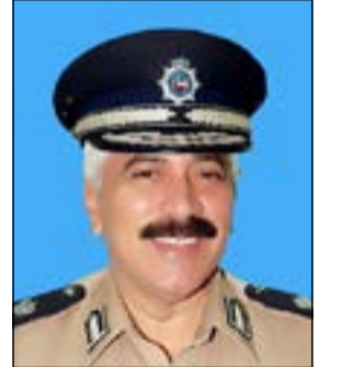
لواء محمود الدوسري

وأضاف أن وزارة الداخلية بالتعاون مع الجهات المعنية في وزارات ومؤسسات الدولة وضعت خطة تأمين فعالية المؤتمر من قبل انعقاد جلساته وحتى مغادرة الوفود المشاركة، وهي الخطة التي اصدر توجيهاته بشأنها معالي نائب رئيس مجلس الوزراء ووزير الداخلية الشيخ محمد الخالد، ويتابع تنفيذها وكيل وزارة الداخلية رئيس اللجنة الأمنية والمشرف العام الفريق سليمان فهد الفهد.