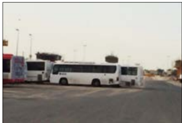
باصات احتجزت تمهيدا لنقلها الى كراج الحجز

لواء العلي أكد من خلالها ان باصات النقل الجماعي ينفذ عليها القانون، وأشار المصدر الى ان جميع الباصات والشاحنات التي تم احتجازها ملزمة باعادة الفحص. ولفت المصدر الى ان هذه الحملات سوف تستمر في مختلف محافظات الكويت، مؤكدا ان المصلحة العامة تقضي بعدم السماح لاي مركبة يصدر عنها عوادم بالسير في الطرقات.