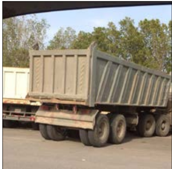
الشاحنات شملتها الحملة المرورية الموسعة