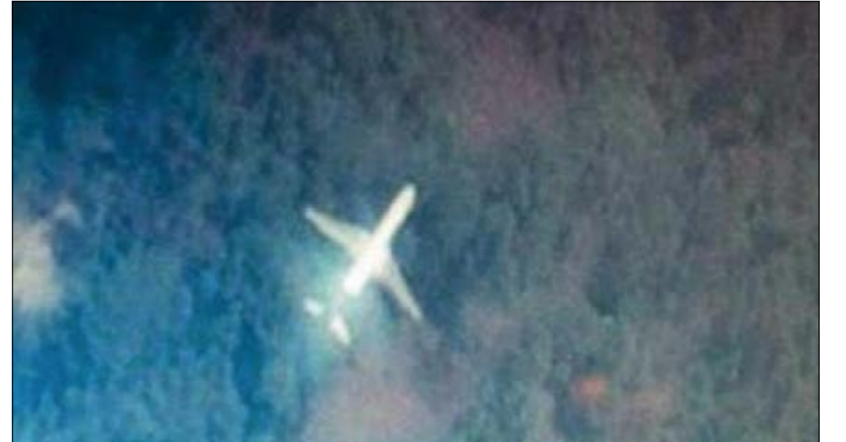
الصورة الافتراضية للطائرة الماليزية