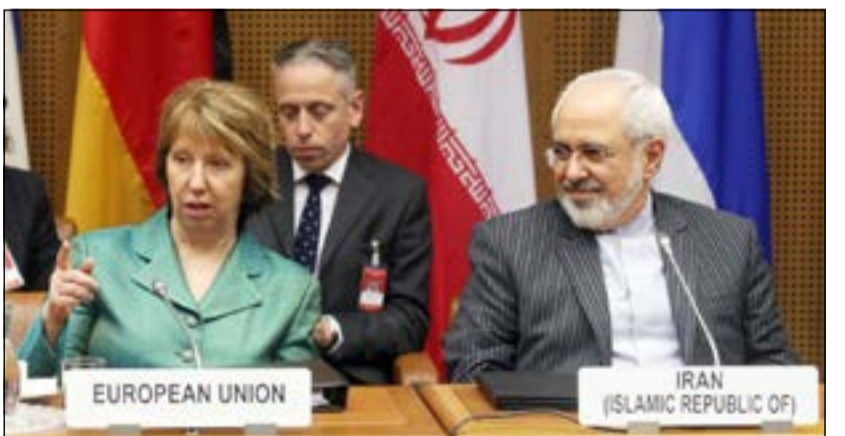
ظريف واشتون قبل بدء إحدى جلسات المفاوضات في فيينا أول من أمس (أب)

معززة خصوصا لتقييد الصادرات النفطية الإيرانية والمنتجات البتروكيميائية بشكل يمكن معه البدء بها فوراً في حال رفضت إيران التوقيع على اتفاق نهائي». ومن النادر أن يوقع مثل هذا العدد من أعضاء مجلس الشيوخ نصا مشتركا ولكن غضب النووي الإيراني يشكل منذ عدة أشهر جبهة موحدة من جانب الأعضاء الديموقراطيين والجمهوريين الذين يريدون التصويت منذ الآن على عقوبات لحمل طهران على القبول باتفاق نهائي. ويتخذ ظريف لرويترز الأميركي خطأ أكثر تشددا إزاء إيران من البيت الأبيض. إلى ذلك، أعرب وزير الخارجية الإيراني محمد جواد ظريف عن تفاؤله بأن تتمكن طهران والقوى العالمية من التوصل إلى اتفاق موسع بخصوص النزاع النووي بحلول 20 يوليو المقبل، لافتا إلى أن المفاوضات تسير بشكل «جيد» حتى الآن. وقال ظريف لرويترز امس ردا على سؤال حول ما إذا كان يتوقع أن يفي المفاوضات بالمهلة «نعم أتوقع ذلك. أنا متفائل إزاء مهلة 20 يوليو». وكان مساعد وزير الخارجية الإيراني وكبير المفاوضين الإيرانيين في فيينا عباس عراقجي قد قال مساء امس الاول أنه «من الميكرد جدا» مصادقة اتفاق نهائي مع الدول الكبرى حول برنامج طهران النووي، مرجحا استئناف المحادثات مجددا في الفترة من 7 إلى 9 ابريل المقبل في فيينا، ونقلت وكالة الأنباء الإيرانية الطلابية عن عراقجي قوله امس أن «هذه المفاوضات لم تتأثر بإزمة أوكرانيا التي تتواجه فيها روسيا والغربيين»، مشيرا إلى أن «الروس والغربيين اصروا على عدم التطرق إلى هذا الملف لكن من الطبيعي ان تلقى الإزمة بظلمها» على المفاوضات.