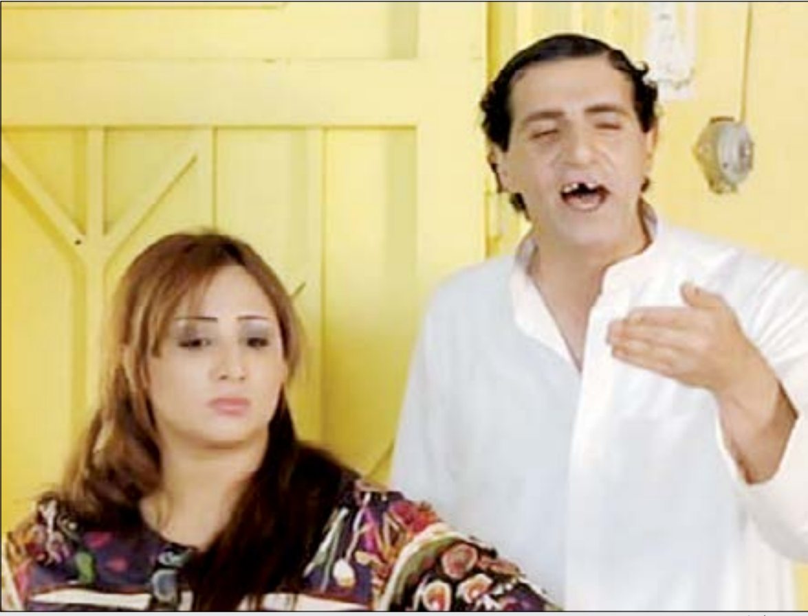
..في مسلسل «بودروش»