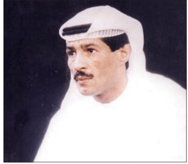
الفنان الراحل يوسف المرطرف