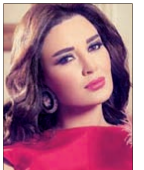
سيرين عبد النور