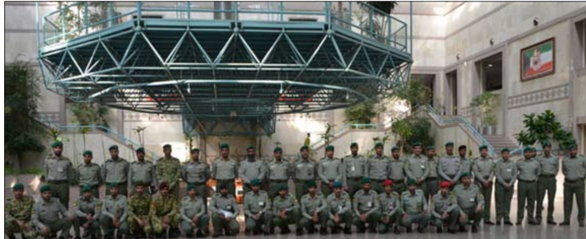
قائد التنظيم، متوسطاً خريجي الدورة

تخضع لاعتبارات عدة، منها توجيهات القيادة العليا للحرس الوطني والتنظيم الاستراتيجي الأمثل، ونسب استكمال الوحدات وحاجة الوحدات من التخصصات والخبيرات. حضر افتتاح الدورة رئيس فرع تطوير النظم