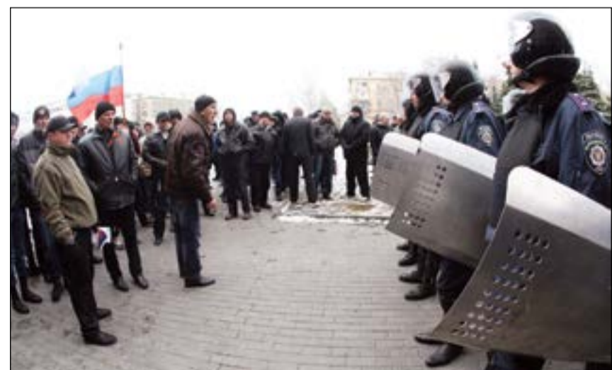
متظاهرون مولون لروسيا يتواجهون مع الشرطة امام مبنى الحكومة الاقليمية في مدينة دونيتسك

انثنين مقربين من الرئيس فلاديمير بوتين وناخبين في مجلس النواب (الدوما). وفي الجانب الأوكراني، استهدفت واشنطن اثنين من المسؤولين الانفصاليين في القرم ويانوكوفيتش وأحد مستشاريه. ويأتي إعلان الحكومة الأميركية على اثر