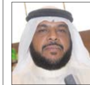
الشيخ احمد منصور الاحمد

مجلس الوزراء اعتمد مرسوم نظام المحافظات بشكل نهائي تعيين المنصور مديراً لـ «الشباب والرياضة» والغنيم وكيلا لـ «الأشغال» والغانم وكيلا مساعداً والتجديد للتركيب والعلي