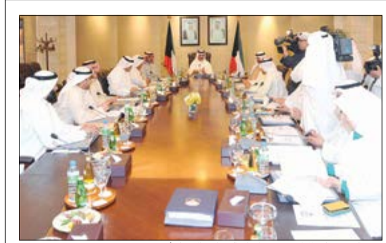
سمو الشيخ جابر المبارك مترشحا لجلسة مجلس الوزراء أمس

خالد الجفيل هدد النائب رياض العدساني باستجواب وزير النفط د.علي العمير بعد 3 أيام إذا لم يجب عن أسئلته البرلمانية عن قضايا «الداو»