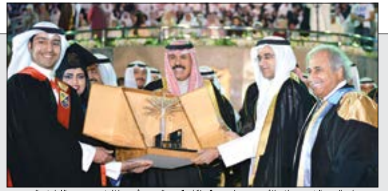
سمو ولي العهد الشيخ نواف الأحمد يتسلم هدية تذكارية من الوزير أحمد المليفي ود. عبداللطيف البدر

ولي العهد رعى حفل التخرج الموحد لخريجي الجامعة: وطنكم المعطاء يناديكم لتمدوا إليه أياديكم بالوفاء والبذل حتى تشاركوها في بناء نهضته 50