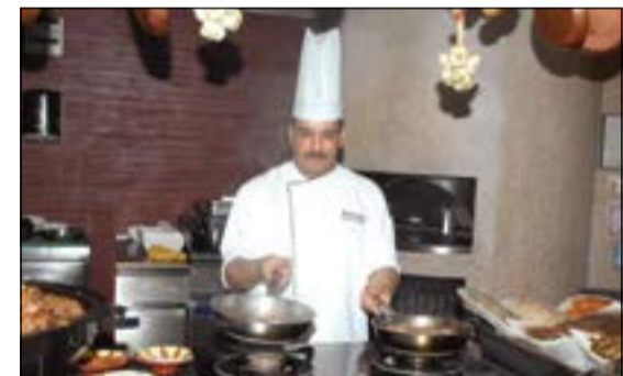
اعداد اشهى الاطباق

العديد من العروض المميزة منها: ليلي باربيكيو الأسماك كل يومى خميس وجمعة ابتداء من الساعة 7,30 مساء وحتى 11,30 ليلاً وذلك بمطعم «بلداني»، حيث