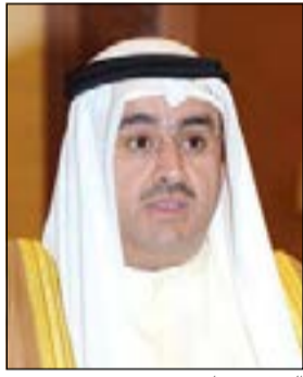
السفير صادق معرفي

فيينا - كونا: رحبت الكويت بقرار الجمعية العامة للأمم المتحدة بعقد جلسة خاصة في عام 2016 حول مشكلة المخدرات في العالم.