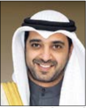
الشيخ محمد العبدالله

أصدر سمو رئيس مجلس الوزراء الشيخ جابر المبارك قراراً وزارياً بشأن تحديد الوزير المختص بتطبيق أحكام القانون في شأن المعاملات الإلكترونية بين الجهات الحكومية في الدولة، حيث يتولى وزير الدولة لشؤون مجلس الوزراء الشيخ محمد العبدالله وتكون له السلطات والصلاحيات المنوطة بالوزير.