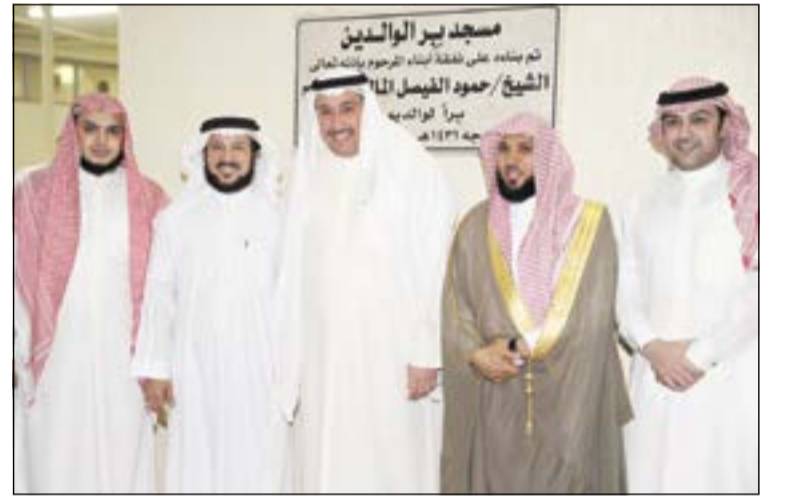
الشيخ فيصل الحمود وإمام الحرم المكي الشيخ د. ماهر المعقبلي والحضور