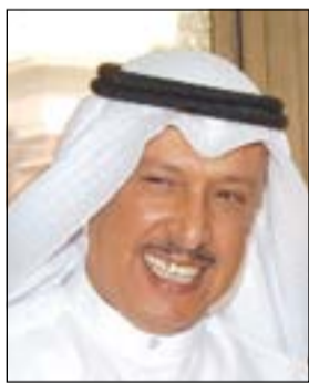
السفير مبارك العدواني

استضافة الكويت عددا من الفعاليات الإقليمية والدولية خلال الأشهر الأخيرة تؤكد الدور المحوري والمهم للكويت على صعيد تعزيز العمل العربي المشترك. وأضاف أن بلاده كانت ولا تزال تتبنى القضايا العربية، منوها باستضافتها للقممة العربية - الأفريقية الثالثة في نوفمبر الماضي والمؤتمر الدولي الثاني للمناخين لدعم الشعب السوري والقمة الخليجية التي عقدت في ديسمبر الماضي،