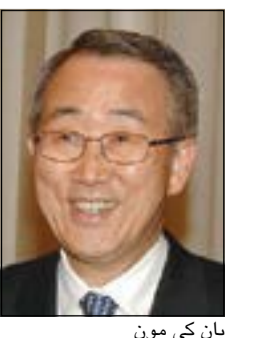
بان كي مون

وذكر بان أن السلطات العراقية قامت بحفرات في مواقع مختلفة للبحث عن رفات المواطنين الكويتيين وغيرهم من المفقودين منذ غزو الكويت عام 1990 إلا أن كل هذه الجهود لم تسفر عن نتائج مشيرة إلى المخاوف الأمنية التي تعوق خطط البحث في بلدة «سليمان بيك» شمال بغداد. وحث السلطات العراقية على مضاعفة جهودها واستكشاف كل الحوافر الممكنة لإقناع الشهود والمخبرين لمساعدتهم في عملية البحث. ودعا كلا من اللجان العراقية والكويتية الخاصة بالممتلكات المفقودة على العمل بشكل وثيق وعقد اجتماعات على أساس منتظم، لافتاً إلى أن بوسنتي حث الممثلين العراقيين والكويتيين في وقت سابق لعقد اجتماع مشترك للجان الخاصة بهم التي لم تجتمع منذ لقائهم الأول والوحيد في الـ 15 من شهر مايو الماضي في الكويت.