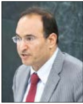
السفير منصور العتيبي

نيويورك - كونا: جددت الكويت ترحيبها بالقرار الدولي رقم 2139 الخاص بالوضع الإنساني في سورية. وفي كلمة أمام الجلسة الخاصة لإحاطة الممثل الدولي والعربي المشترك الى سورية الأخضر الإبراهيمي أمام الجمعية العامة أمس الأول قال مندوبنا الدائم لدى الأمم المتحدة السفير منصور العتيبي إن تلك الاحاطات رغم عدم حملها أي مؤشرات إيجابية فإنها حذرت من استمرار تدهور الوضع والصورة القاتمة لمستقبل سورية وربما المنطقة في حال لم يتم التوصل لحل سلمي ونسوية سياسية للأزمة. وأكد العتيبي دعم الكويت لجهود المبعوث المشترك لمواصلة عمله مع جميع الأطراف لاستئناف المفاوضات لضمان التنفيذ الشامل لبيان جنيف الصادر في 30 يونيو 2012.