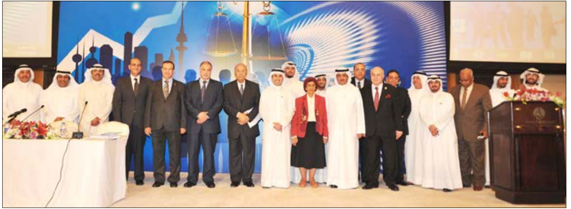
صورة جماعية عقب انتهاء المؤتمر

قدم نائب عميد جامعة بني سويف د. رايح رتيب، درعا تذكارية باسم الجامعة إلى وزير المالية أنس الصالح، لدوره في إصدار قانون الشركات الجديد خلال توليه حقيبة وزارة التجارة والصناعة، وقدم رتيب الدرغ إلى الصالح على هامش ختام أعمال مؤتمر الكويت الأول لمناقشة أهم المستجدات في قانون الشركات الجديد، والأحكام المتعلقة بتوفيق أوضاع الشركات القائمة، والذي أقامه مكتب لؤي الخرافي للمحاماة والاستشارات القانونية بين 10 و12 الجاري.