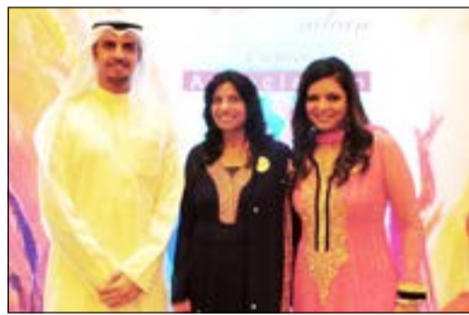
مسؤولو الأهلي خلال تقديم الرعاية للجمعية

تطبيقاً لسياسة البنك الأهلي الكويتي والتزامه بمسؤولياته الاجتماعية في دعم العديد من الأنشطة الصحية والاجتماعية، وفي إطار رعايته للجمعية الهندية للمرأة، تم تكريم البنك والشركات الراعية والمساهمة في حفل كبير بحضور سفير الهند في الكويت سونيل جين ومجموعة من كبار الشخصيات من مختلف الجاليات. وتمثل رعاية البنك الأهلي الكويتي للجمعية الهندية للمرأة للمسة الرابعة على التوالي مدى اهتمام البنك بدعم مختلف شرائح المجتمع وخاصة المرأة والطفل، وذلك من خلال الدعم المادي والمعنوي لتحفيزهم على القيام بمزيد من الأنشطة التي تخدم المجتمع. كما يقدم البنك الأهلي الكويتي مساهمات وتبرعات لدعم ورعاية الكثير من الأنشطة والفعاليات الرياضية والثقافية والاجتماعية والصحية التي يهتم بها المجتمع، وقياسه بدور متميز وفعال في كل المجالات التي من شأنها دعم التواصل بين البنك والمؤسسات الاجتماعية. وخلال الحفل تقدمت رئيسة الجمعية الهندية للمرأة بالشكر الجزيل للبنك الأهلي الكويتي على دعمه ورعايته للجمعية الهندية وتمنت دوام التوفيق للجميع واستمرار العلاقة مع البنك.