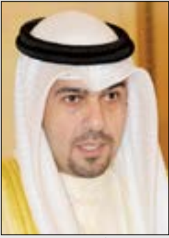
وزير المالية أنس الصالح

قدم نائب عميد جامعة بني سويف د. رايح رتيب، درعا تذكارية باسم الجامعة إلى وزير المالية أنس الصالح، لدوره في إصدار قانون الشركات الجديد خلال توليه حقيبة وزارة التجارة والصناعة، وقدم رتيب الدرغ إلى الصالح على هامش ختام أعمال مؤتمر الكويت الأول لمناقشة أهم المستجدات في قانون الشركات الجديد، والأحكام المتعلقة بتوفيق أوضاع الشركات القائمة، والذي أقامه مكتب لؤي الخرافي للمحاماة والاستشارات القانونية بين 10 و12 الجاري.