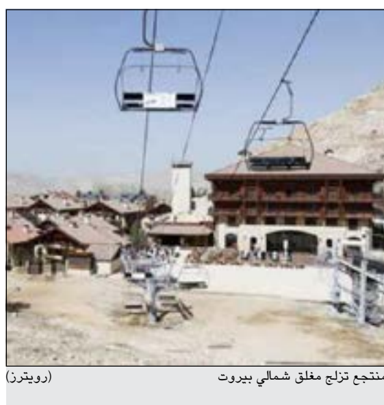
منتجع تزلج مغلق شمالي بيروت