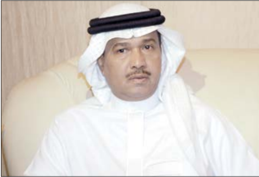
فنان العرب محمد عبده

حلبة البحرين الدولية، وسيتم الإعلان قريبا عن حفلتين آخرتين لتجوم آخرين.