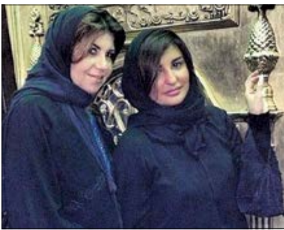
شذى حسون ومعها بوسي شلبي في السيدة نفيسة

بين الحمام المحشو والذرة المشوية وحمص الشام، تستمتع النجمة شذى حسون بتضمين وقتها في مصر، التي تزورها بعد غياب ثلاث سنوات. وأكدت شذى في تصريح لها، سعادتها بالعودة إلى مصر، وأنها تناولت وجبتها المفضلة في مصر وهي الحمام المحشو، كما التقت حسون ببعض زملاء والأصدقاء في الوسط الفني، ومنهم ليلبة ومحمد منير وغيرهم الكثير، وقامت بزيارة بعض المعالم السياحية، كان أحدثها مقام السيدة نفيسة. ونشرت شذى صوراً لها أمام مقام السيدة نفيسة، وكتبت معلقة عليها: «شذى حسون في زيارة لمقام السيدة نفيسة في مصر وأدعية من القلب»، حيث غطت شعرها بالحجاب، ورافقها الزيارة الإعلامية المصرية بوسي شلبي.