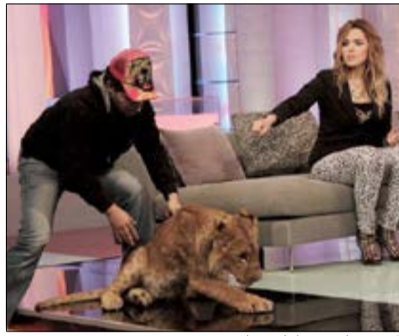
الأسد في استديو «أحلى مسا»