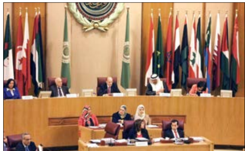
نيل العربي مترشحا الاجتماع الـ 41 لمجلس وزراء الصحة العرب

وطالب د.العربي بضرورة بذل كل الجهود الصحية والانسانية للتخفيف من معاناة أبناء الشعب السوري وتقديم العون الصحي للأشقاء في فلسطين والصومال واليمن وجزر القمر. وأشار إلى أن دورة مجلس