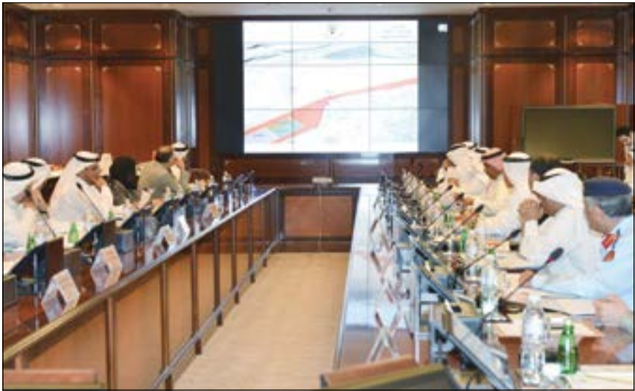
عرض المواقع المقترحة لإقامة المشروع