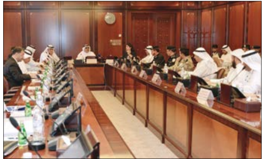
الشيخ أحمد مشعل الأحمد أثناء الاجتماع مع ممثلي الجهات الحكومية المعنية بالمشروع

معوقات يواجهها المشروع. وذكر أن البلدية قامت خلال الاجتماع بعرض مخطط تم إعداده مؤخرا تضمن موقعا بديلا عن المواقع التي تم رفضها في وقت سابق من شركة نفط الكويت ووزارة الداخلية والمستثمر الأجنبي.