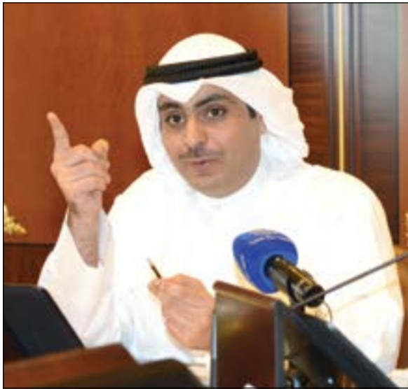
الشيخ أحمد مشعل الأحمد أثناء الاجتماع