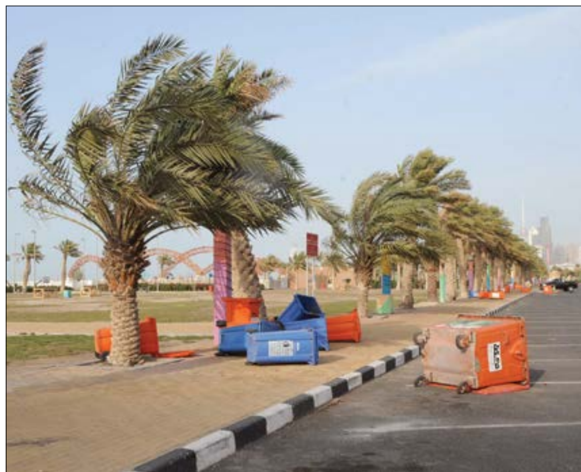
حاويات القمامة وقد وقعت على الأرض نتيجة هبوب الرياح وتبدو الصورة بعد أن ترسب الغبار تدريجيا (ماني الشمري)

ضربت موجة غبار عنيفة مناطق واسعة بالبلاد عصر امس حيث انعدمت الرؤية في عدد من الطرق والشوارع وتسبب في شلل مروري. وكان خبير الأرصاد الجوية عيسى رمضان قال صباح امس عبر حسابه في تويتر ان رياحا شمالية غربية تهب وتكون نشطة مؤثرة للغبار وتنخفض درجات الحرارة والرطوبة النسبية ويبرد قليلا الطقس ليلا في الأيام المقبلة.