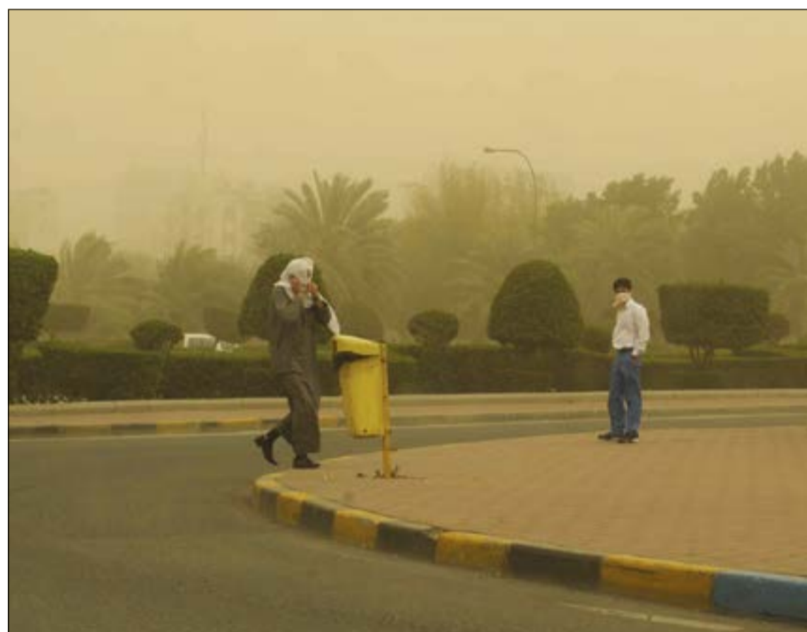
يحتميان من الغبار كل بطريقة الخاصة (قاسم باشا)

هنالك زيادة في نشاط الرياح وما يصاحبها من غبار مثار مشيرة الى ان الرياح الشمالية الغربية النشطة التي تهب على الكويت تبلغ سرعتها نحو 60 كيلومترا في الساعة. وأعلنت إدارة نظم المعلومات في الإدارة العامة للطيران المدني ان حركة الملاحة الجوية طبيعية، ووفي حال تدني الرؤية فمن المتوقع تحويل بعض الرحلات إلى مطارات أخرى.