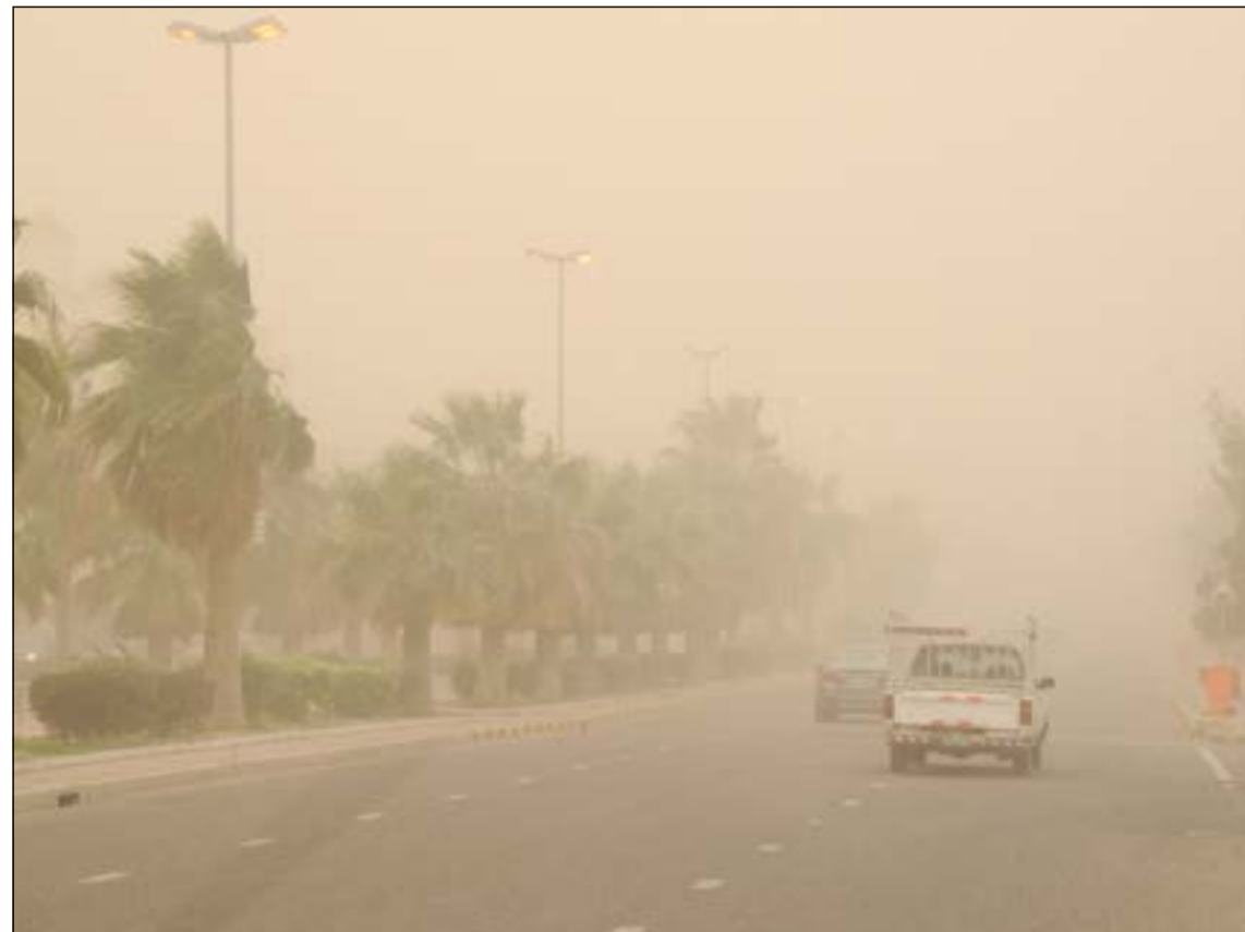
غبار أحجب الرؤية في طرق الكويت

كويتية يومية سياسية شاملة، تأسست عام 1976 تطبع في مطابع «الأنباء» تصدر عن شركة باب الكويت للصحافة ذ.م.م. الشويخ، طريق المطار، شارع الصحافة ص.ب. 23915 الصفاة، الرمز البريدي 13100 كويت editorial@alanba.com.kw