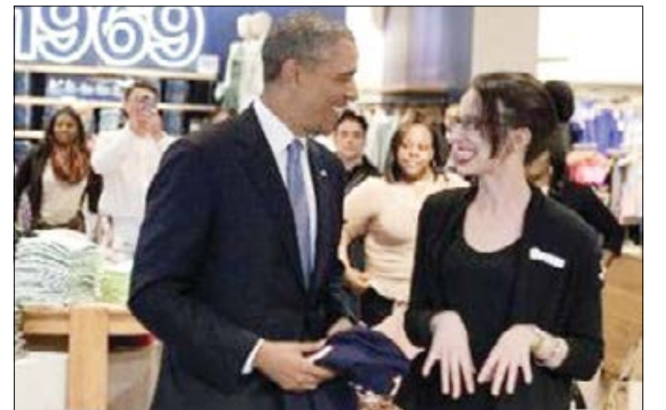
أوباما يتحدث باريحية مع عاملة المتجر

نيويورك - وكالات: قام باراك أوباما في نيويورك بالتسوق سريعاً في متجر للألبسة زاد قبل فترة قصيرة الحد الأدنى لأجور العاملين فيه، وهو إجراء يدعمه الرئيس الأميركي ويعارضه الكونغرس.