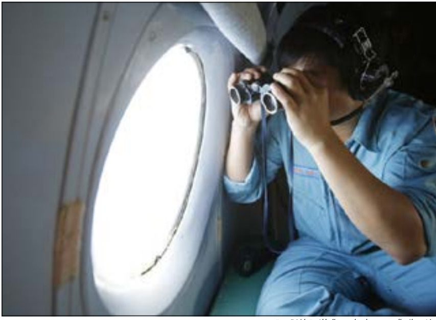
ولا يزال البحث جارياً عن الطائرة المفقودة

وكان مسؤول ماليزي طلب عدم ذكر اسمه قد قال لـ CNN إن أجهزة الرادار الماليزية ظلت ترصد الطائرة لمدة ساعة بعد انقطاع الاتصال بها، لتختفي بعد ذلك عن الشاشة فجأة، مضيفاً أن الطائرة غيرت مسارها وانحرفت عن وجهتها المقررة بمئات الأميال دون انتضاح سبب ذلك، مضيفاً أن الطائرة رصدت للمرة الأخيرة فوق جزيرة بمضيق ملقة.