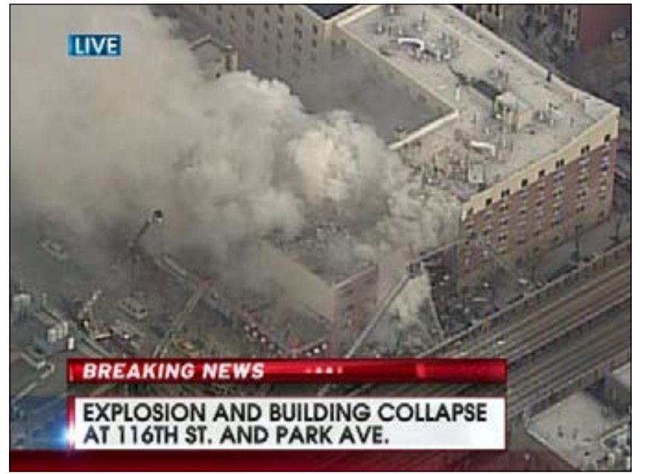
لحظة الانفجار كما التقطته كاميرات التلفزيون

ديي - سي. إن. إن: ازداد الغموض الذي يلف قضية الطائرة الماليزية المفقودة منذ السبت، مع بروز تقارير صحافية عرضت شهادات لأقارب عدد من الركاب الذين كشفوا أن هواتف أقاربهم ظلت ترن لساعات طويلة أعقب الإعلان عن فقدانهم، في حين أوقفت فيتنام عمليات البحث بانتظار معلومات من ماليزيا بعد تقارير حول تغيير كبير حصل بمسار الطائرة. وذكرت التقارير أن أقارب الركاب اتصلوا بهم خلال الساعات التي أعقبت فقدان الطائرة، بينما وصف ناشطون عبر مواقع التواصل الاجتماعي ما جرى بظاهرة «الاتصال الشبح»، معتبرين أنها تؤكد أن الطائرة لم تتحطم أو تسقط في قعر المحيط، كما تشير الترحيحات. من جانبه، قال خبير شؤون المعلوماتية والاتصالات، جيف كاغن، في