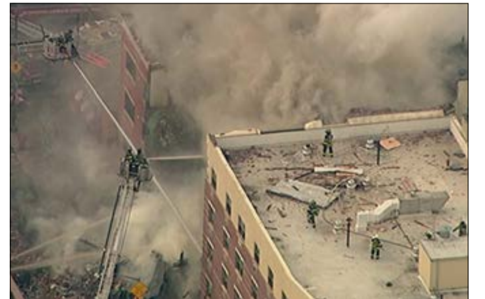
رجال الإطفاء يحاولون السيطرة على الحريق

اختفاء تلك الطائرة هو الأغرب بين اختفاءات بحرية لعدد قليل جداً من طائرات لم يعثروا عليها في البحار والمحيطات للآن، واطلعت «العربية» نت، عليها لتكتب عن أكثرها شهرة، وهي التي ابتلعها بحر بيروت، الواردة معظم تفاصيلها في صفح تطرقت إليها قبل أكثر من 56 سنة، وحصلت عليها ذلك الوقت من تحقيقاتها الميدانية وما لدى شركة «لويديز» للتأمين، وما أصبح أرشيفا دمويًا في «المديرية العامة للطيران المدني» في لبنان. فبعد 17 دقيقة من إقلاع الطائرة، وهي لبنانية بمركبين، وكان على متنها طاقم من 4 أفراد و23 ركاباً إلى الكويت، مع شحنة سبائك ذهبية للبحرين، وزنها 400 كيلوغرام «موضبة» في 15 صندوقاً معدنياً، يتلقى منها برج المراقبة بمطار بيروت عند الثانية 11 أو 12 دقيقة بعد ظهر 3 أكتوبر 1957 أول نداء استغاثة. كان النداء بصوت طيارها شكر الله أبي سمرا، وقاله بذعر واضح «ألو.. ألو.. أنا كاين الـ Curtiss C 46 التابعة لشركة