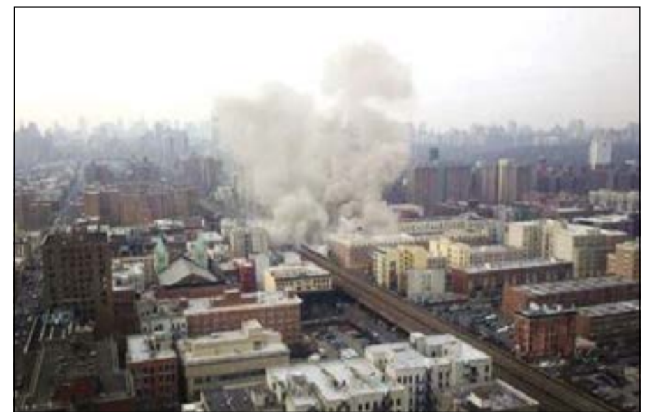
أسلة الدخان تتصاعد في سماء نيويورك