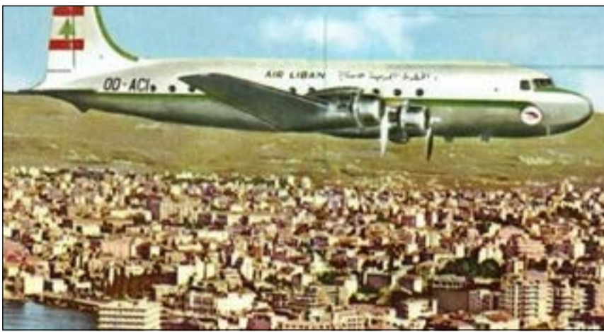
بيروت في الخمسينيات وطائرة لبنانية تعلق

بالبحث عنها، حتى شمر عن ساعديه ووصل عام 2000 إلى بيروت، ومعه أجهزة غوص متطورة، أما أن يختشل من الأعماق «كنز لبنان» كما سماه، فيخرج بحصة 75٪ اتفق بشأنها مع السلطات اللبنانية. وجاء السويدي سفيركو هالستروم، البالغ عمره 68 سنة الآن، إلى بيروت على رأس فريق مزود بغواص آلي قادر على النزول إلى عمق 2000 متر تحت الماء، وتتحكم به أجهزة إلكترونية من على متن سفينة اسمها «سكوربيو»، وطولها 48 متراً، فاجر مع معاونيه في مواقع مائية تمتد 5 كيلومترات على طول الساحل البيروتي وما تعدها، والتقط صوراً باهظة استشار ورصد دقيقة لأعماق كل ما كانت تمر فوقه «سكوربيو» مراراً، لكنه عاد بسلة ليس فيها إلا الإحباط، وغادر ولم يعد.