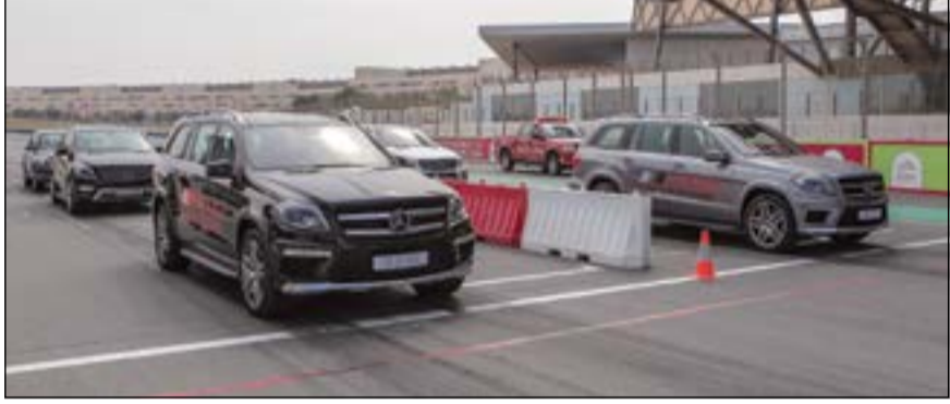
مجموعة سيارات مرسيدس-بنز SUV تتحضر للسباق على الحلبة