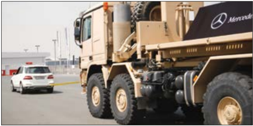
GL تستعرض قوتها وتجر شاحنة عملاقة

مع ديناميكية قيادة ممتازة ومستويات عالية من راحة القيادة - سواء كان ذلك على الطرقات المعبدة أو الوعرة - فإن الفئة GL تدلل ركبها مع راحة من الدرجة الأولى كما في سيارات الصالون الفاخرة. يتمتع ما يصل إلى 7 ركاب بمقدار ممتاز من المساحة وتتوافر اختياراتها حزمة ON&OFFROAD للفئة - GL الجديدة بـ 6 وضعيات للقيادة، والتي تقدم ديناميكية القيادة وسلامة التحكم على الوجه الأمثل، حيث تم تزويد المجموعة الواسعة جدا من ظروف التشغيل على الطرقات المعبدة والوعرة بالتحكم الأمثل بنظام الدفع.