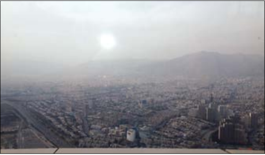
طهران من أعلى برج الميلاد