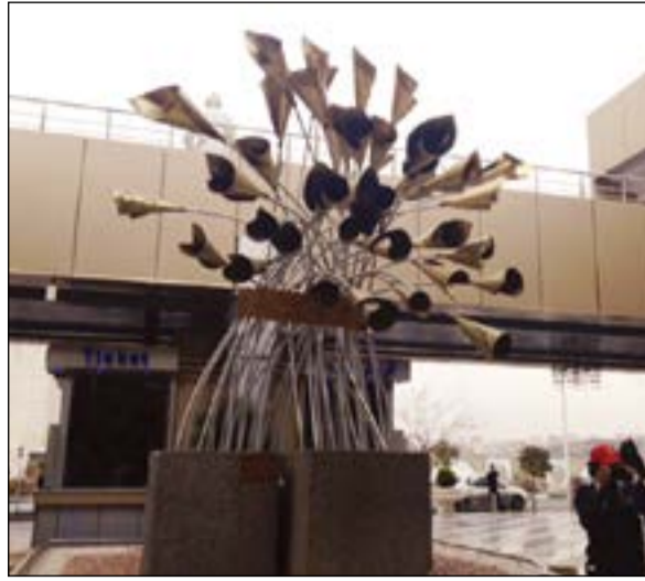
مجسم من الزهور لشهداء الحرب العراقية - الإيرانية