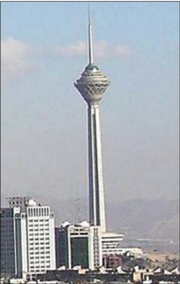
برج الميلاد وسط طهران