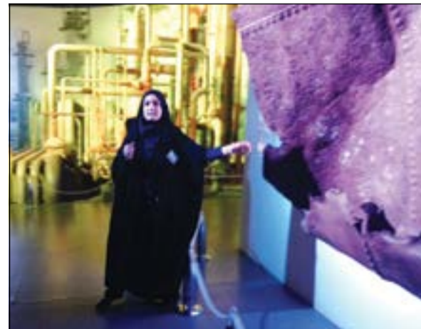
مرشدة سياحية إيرانية تشرح آبار النفط للدمار خلال الحرب