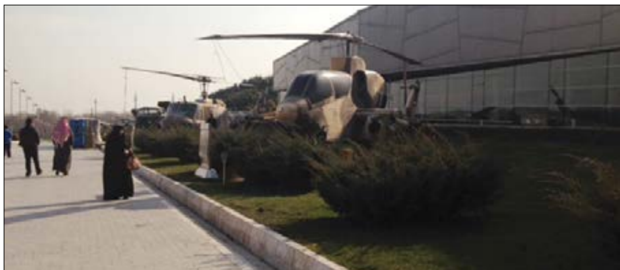
جناح الطائرات بالمتحف