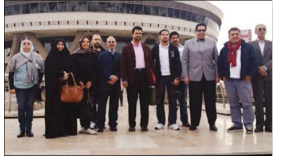
الوفد الاعلامي امام برج الميلاد