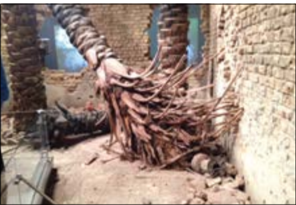
مجسم لاقتلاع أشجار النخيل إبان الحرب مع العراق

ثمانية أيام قضاهما الوفد الثقافي الاعلامي الكويتي متفلا بين معالم مدينة جمعت التاريخ والحضارة إلى جانب الحدائق والتطور. مدينة تحددت الحصار المستمر عليها منذ 20 عاما، كما تحددت الحروب الطويلة والأزمات المتلاحقة لتخرج منها جميعا أقوى وأكثر تطورا. ولا يمكن أن تنكر التطور الكبير بهذه المدينة التي لم تخرج من الأزمات والحروب منذ عقود، انها مدينة طهران المتميزة الهادئة رغم الأزدهام المروري، ينبهر الداخل إليها بما يشاهده من نهضة عمرانية وشبكات طرق متميزة وحركة لا تهدأ. لاسيما ان الزيارة تزامنت مع التحضير لاحتفال رأس السنة الفارسية عيد النوروز. الزيارة التي كانت بدعوة من المستشارة الثقافية الإيرانية بالكويت أخذت شقين: الأول جولات سياحية شملت منزل مسجد الإمام الخميني وبرج الميلاد والمتحف العسكري ومتحف سعد اباد منزل الشاه، وتحت شمشيت وضريح الشاعر حافظ الشيرازي وقلعة الوكيل ومسجد قدري ملكه وقصر خانم زينت. والثاني لقاءات ثقافية في جامعة طهران والمكتبة الوطنية ورابطة الثقافة الإيرانية الإسلامية وجامعة الزهراء. وتضمن هذه الزيارات مجموعة من اللقاءات الثقافية والندوات والمحاضرات.