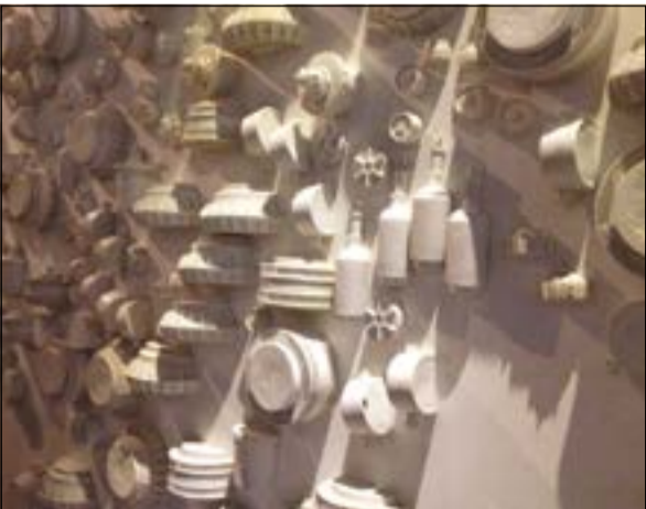
الألغام الأرضية بمعرض المعدات العسكرية