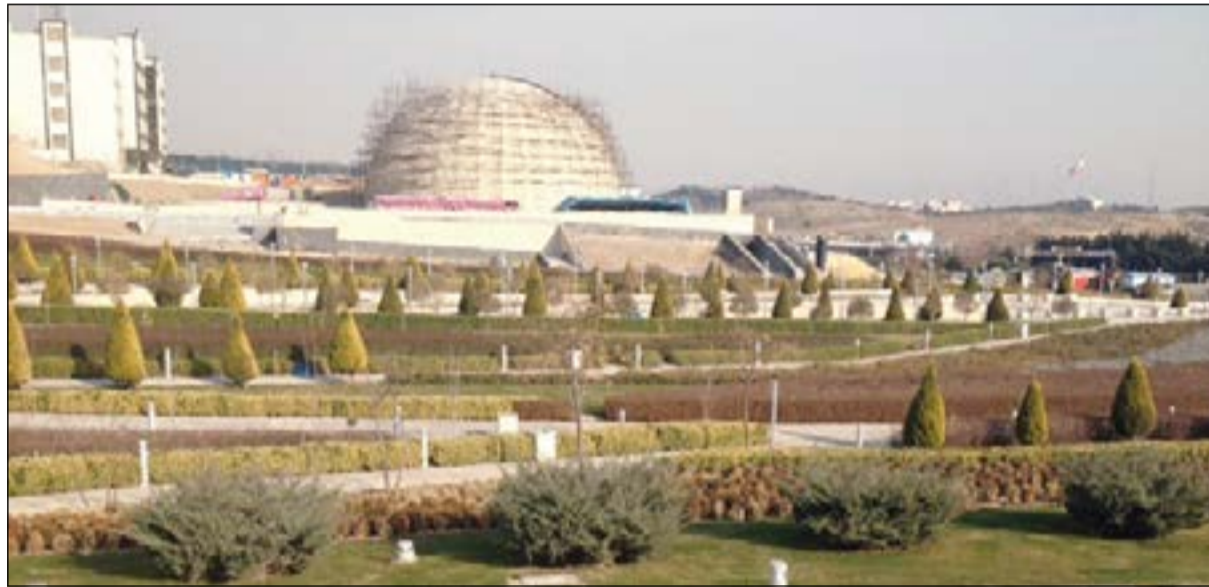
متحف الدفاع المقدس

خاضتها لاسيما مع العراق التي استمرت عدة سنوات، ويضم المحيط الخارجي للمتحف صور لشهداء الحرب وبرز العلم والنجية والناقورة ومتحف بانوراما ومعرض المعدات الحربية والمسجد الجامع، كما يضم 7 قاعات كل واحدة منها تجسد مرحلة من مراحل التاريخ والحروب الحديثة بالإضافة إلى خريطة إيران التاريخية، ومن أبرزها قاعة الصوتيات التي تعرض أفلام قصيرة عبر المؤثرات الصوتية لأحدى الغارات التي نفذها جيش صدام على المدن الإيرانية، وقاعة خاصة بالشخصية، وأخرى للألغام الأرضية والبحرية وصالة الأسلحة المختلفة وصلات للقرى والمدن التي احتلها جيش صدام ودمرها، والافتتاح في المتحف تحويل صناديق الذخيرة إلى مقاعد للجلوس، ورسم العلم الإسرائيلي على سلات النفايات. ويضم المتحف أيضا روضة للأطفال ومركزا طبيا للطوارئ ومطعما ومقهى ومحلا تجاريا للتذكارات الخاصة في المتحف، هو بحق يجسد الثقافة التي تعمل إيران على زرعها في نفوس الأجيال لكي لا تنسى أجيالها الشهداء. أما المحطة الأخيرة من الجولة فكانت في سوق تحريش وهو بازار كبير للتحف اليدوية المختلفة.