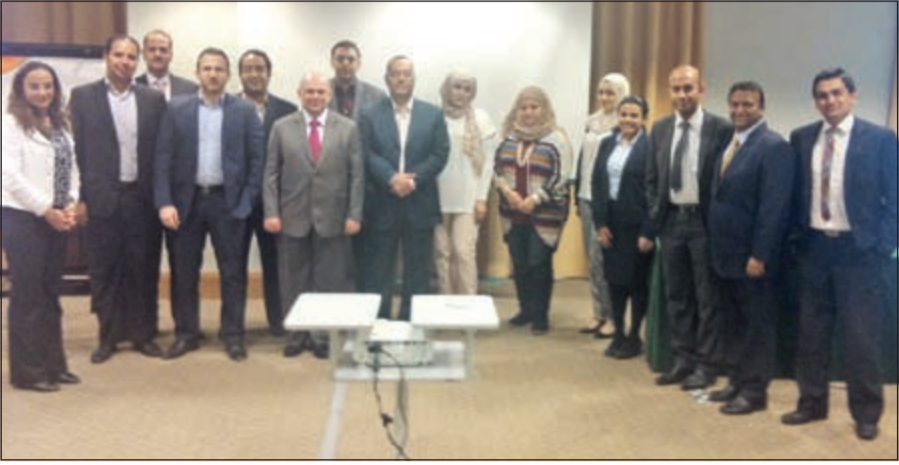
جانب من ورشة العمل

الضوء على اهم السياسات والإجراءات الرقابية والتنظيمية المتبعة وسياسات الحوكمة وفقاً لأفضل المعايير والممارسات العالمية في هذا المجال ودورها في تعزيز الشفافية والنزاهة والمساءلة والالتزام لدى الشركات.