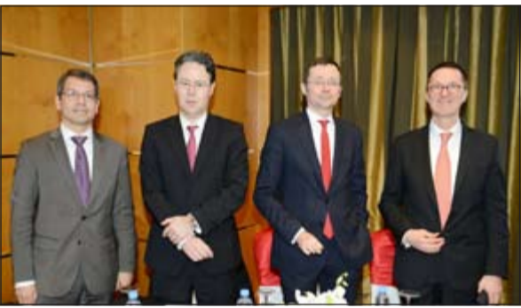
مسؤولو ديكا بنك خلال الندوة الترويجية

تناولت موضوعين هما «العودة إلى مسار النمو» و«ارتفاع العائد الأوروبي - تراجع التصنيف» وافتتاح الندوة نائب رئيس مجلس إدارة البنك أوليفر بيهرينز مؤكداً على سلامة وصحة اقتصاد منطقة اليورو، باعتبار البنك واحداً من أعلى البنوك تصنيفاً في أوروبا واحد أكبر مزودي الخدمات المالية في ألمانيا، حيث حقق البنك أرباحاً تعادل نحو 500 مليون يورو خلال العام الماضي، حيث أن البنك يدير أصول تصل قيمتها إلى 175 مليار يورو منها نحو 72٪ للكويت أي ما يعادل 3,5 مليارات دولار، وأن الميزانية العمومية للبنك تصل قيمتها إلى 120 مليار يورو.