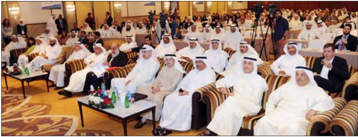
تزار العدساني يتقدم القيادات النفطية وضيوف الحدث

كشف الرئيس التنفيذي لمؤسسة البترول الكويتية نزار العدساني عن إدراك القطاع النفطي لأهمية الكوادر البشرية وكيفية إدارتها، حيث أولى لها اهتماما خاصا لتطوير أنظمة وسياسات إدارات الموارد البشرية وفق معايير ومقاييس محددة تعمل على تحفيز بيئة العمل في القطاع من خلال استقطاب العمالة المؤهلة ورعاية حقوقها وتأمين سلامتها والحفاظ على أصحاب المهارات المتميزة منها.