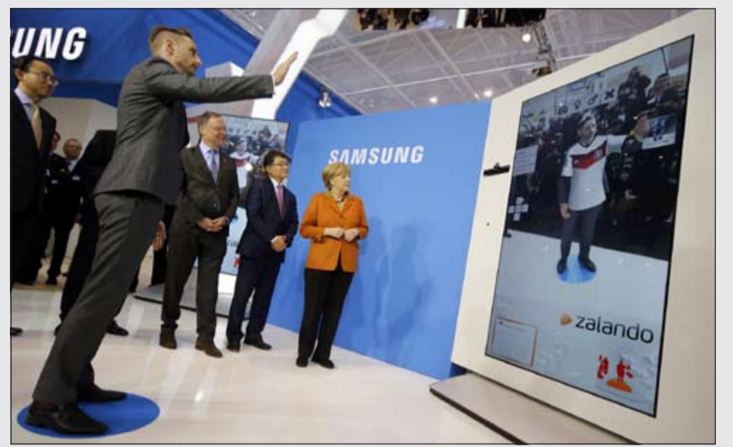
الاستشارة الألمانية انجيليا ميركل تستمع إلى شرح من مسؤولي شركة سامسونج حول التطبيق المحمول للتسوق عبر الإنترنت Zalando

بقطاع بنوك المعلومات والبيانات والمسؤوليات عن استخدام هذه البيانات. ووفق المنظرين فإن المعرض ينتظر في الأيام المقبلة نحو 230 ألف زائر مختص من جميع أنحاء العالم وأن معظم الاختراعات الجديدة تأتي من الصين وألمانيا بينما تأتي بريطانيا في المرتبة الثالثة.