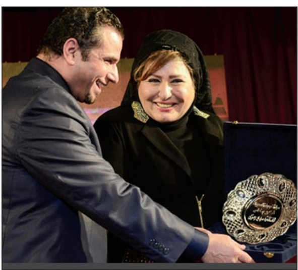
سهير رمزي أثناء تكريمها

على رغم الهجوم الذي تتعرض له سهير رمزي نتيجة تخفيفها من حجابها، إلا أن مجلة «آخر موضة» أختبرتها مؤخراً ضمن عرض ملابس المحجبات أقامته في أحد الفنادق الكبرى في القاهرة، وتم تكريم النجمة المصرية باعتبارها أفضل فنانة محببة، كما تم تكريم لبناء عبدالحامد كأفضل مذيعة محببة. واللافت أن سهير ظهرت بخصلات الشعر نفسها، التي تسببت في الهجوم عليها، إذ أظلت بحجاب يكشف عن خصلات شعرها الملونة، مما اعتبره البعض تمهيداً لخلع الحجاب الذي ارتدته قبل 20 عاماً.