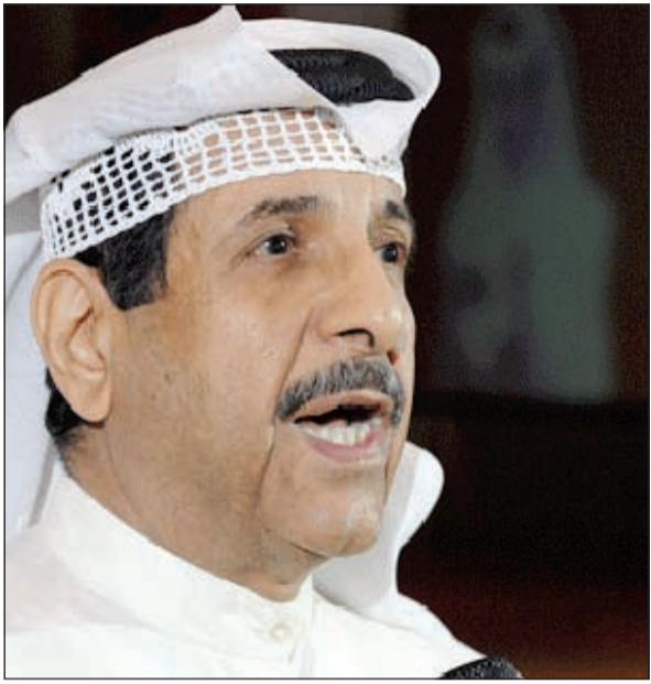
الإعلامي الرياضي محمد المسند