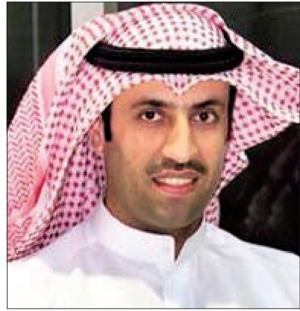
المخرج أمين الدوسري