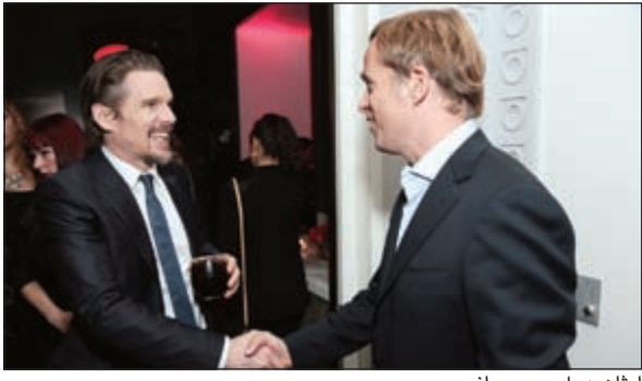
إيثان هوك وجيد داف

رعت دار زينيت حفل مراسلي هوليوود لتكريم المرشحين في الدورة السادسة والثمانين لحفل توزيع جوائز الأوسكار السنوي الذي أقيم في المطعم الأسطوري الراقى لولف غانغ باك ولازاروف، سباغو بيفرلي هيلز. وأحيا الأمسية كل من مراسلة هوليوود الناشرة «لين سيغال» إلى جانب الرئيسة المشاركة ومديرة قسم الإبداع لمجموعة The Entertainment Group of Guggenheim Media «جانيس مين» اللتين رحبتا بعدد من الضيوف البارزين أمثال ليوناردو ديكابريو، إيثان هوك، جاريد ليتو، بيرز مورغان، ستيف كوغان، دانييل راسل وباركهايد أبادي. وتخلل الأمسية عرض لصنع الساعة قدمه أحد الصناع الأساتذة في دار زينيت للترفيه عن الحضور مستعرضاً خلاله الحرفية العالية والمهارات المستخدمة في صنع حركة El Primero الشهيرة. وتسنى للحضور أيضاً أن يكتشفوا تصاميم رائعة من مجموعة ساعات زينيت برفقة جان فريديريك دوفور، الرئيس التنفيذي والمدير العام لسدار Zenith Timepieces.