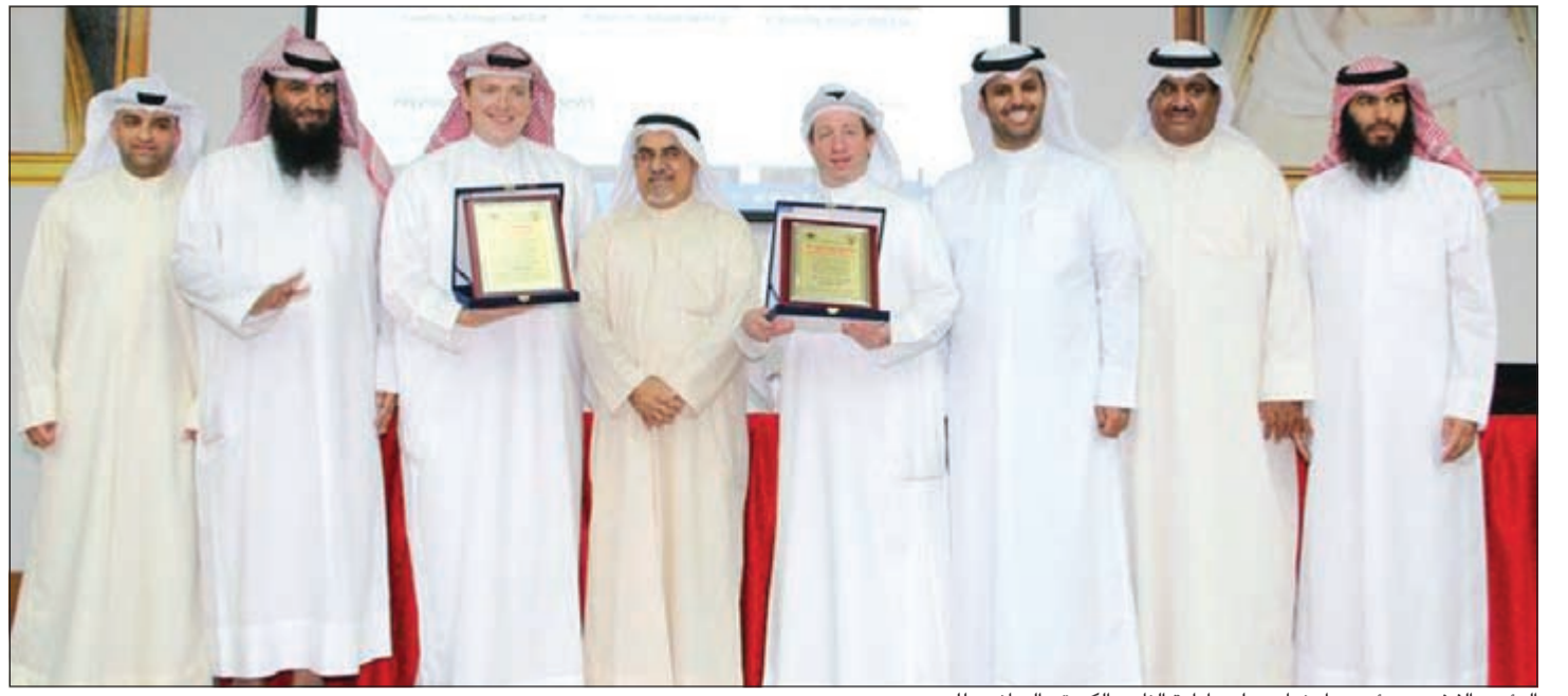
الرئيس الفخري ورئيس واعضاء مجلس ادارة النادي الرياضي للصم