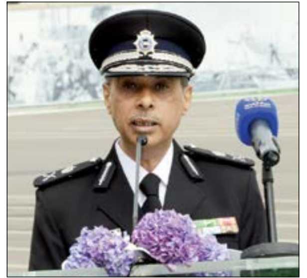
لواء سيف السيف