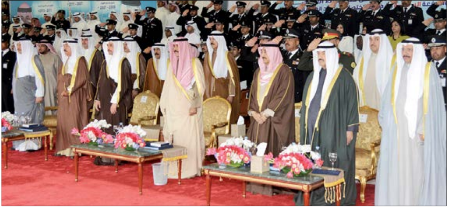
سمو نائب الأمير وولي العهد الشيخ نواف الأحمد ومرزوق الغانم وياسم الخرافي والشيخ جابر العبدالله وسمو الشيخ ناصر المحمد وسمو الشيخ جابر المبارك والشيخ شعلان عبدالعزيز في مقدمة الحضور

برعاية صاحب السمو الأمير القائد الأعلى للقوات المسلحة الشيخ صباح الأحمد