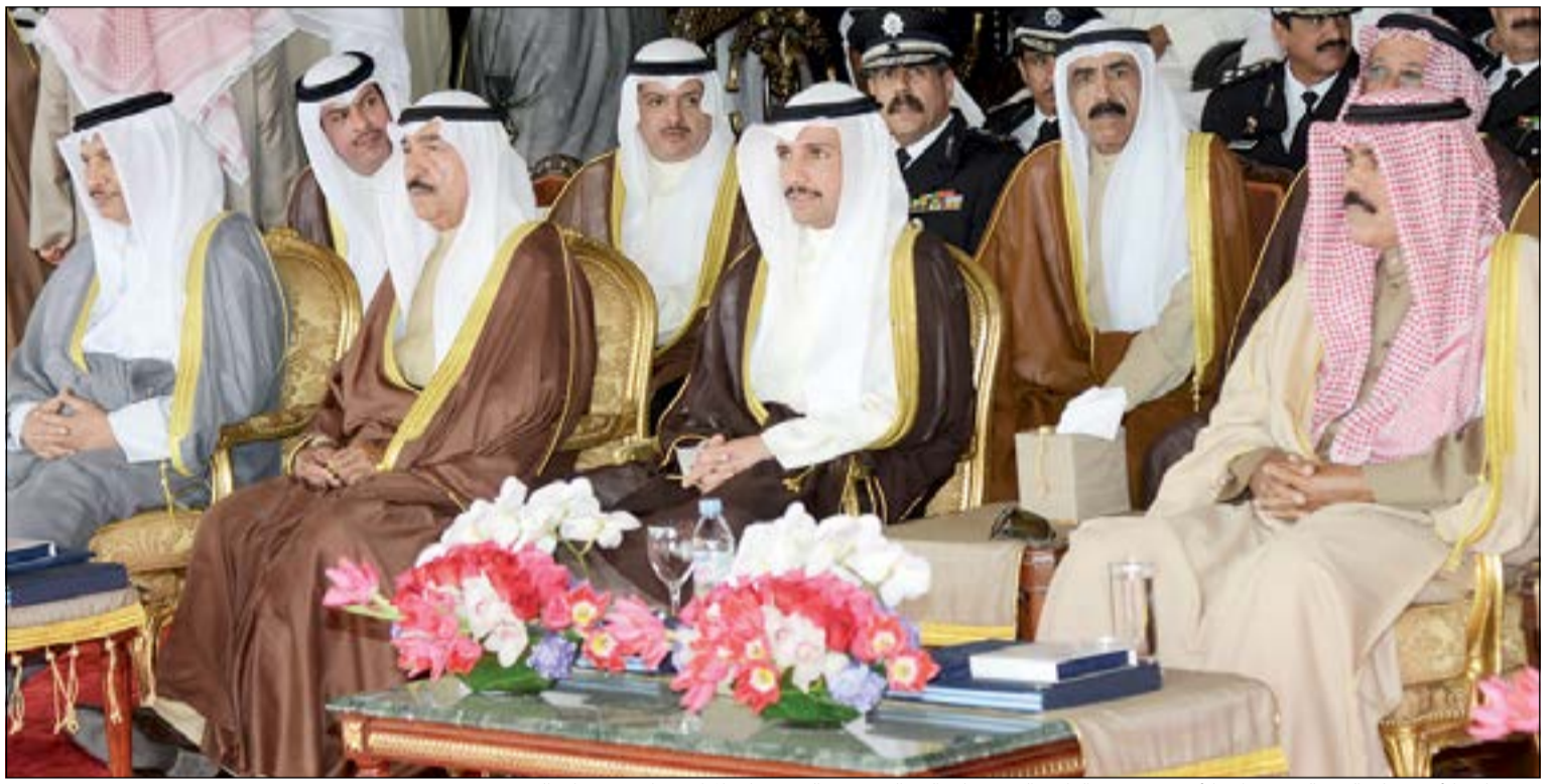
سمو نائب الأمير وولي العهد الشيخ نواف الأحمد ومرزوق الغانم والشيخ جابر العبدالله وسمو الشيخ جابر المبارك يتابعون فقرات الحفل

للانخراط في سلك الشرطة والعمل الميداني بكل كفاءة واقتدار هدفهم حماية أمن الوطن وسلامة المواطن وتطبيق القانون على الجميع والوقوف جنباً إلى جنب صفاً واحداً مع رفقاء السلاح في الجيش الكويتي والحرس الوطني والعمل من أجل الحفاظ على المصالح العليا لأمن الوطن. استأنن سموكم الكريم في ان اتوجه بكلمة لابنائتي وبناتي الخريجين وهم على اعتاب التخرج للحياة العامة في هذا الميدان: استقبلناكم اغرارا ومن هذا الميدان تطلقون ضباطاً تهنئة خاصة من القلب لكم ولاولياء اموركم من آباء وامهات الذين قدموا للوطن فلدات الاكباد عيوناً ساهرة وسواعد فتيحة وبخبر ويعتز بهم الوطن ابناي الخريجين