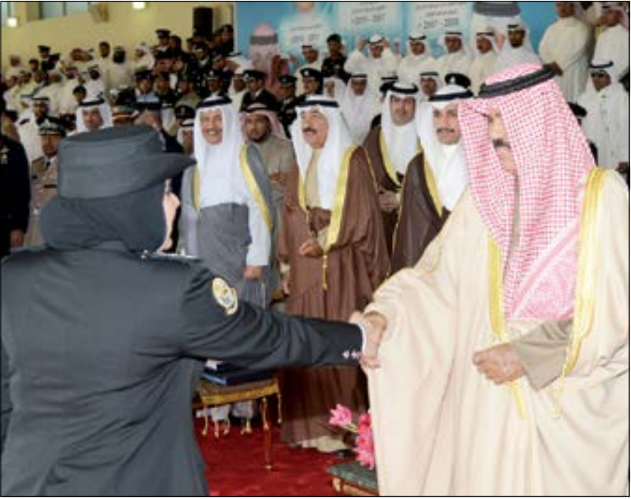
سمو نائب الأمير مبارك لإحدى الخريجات