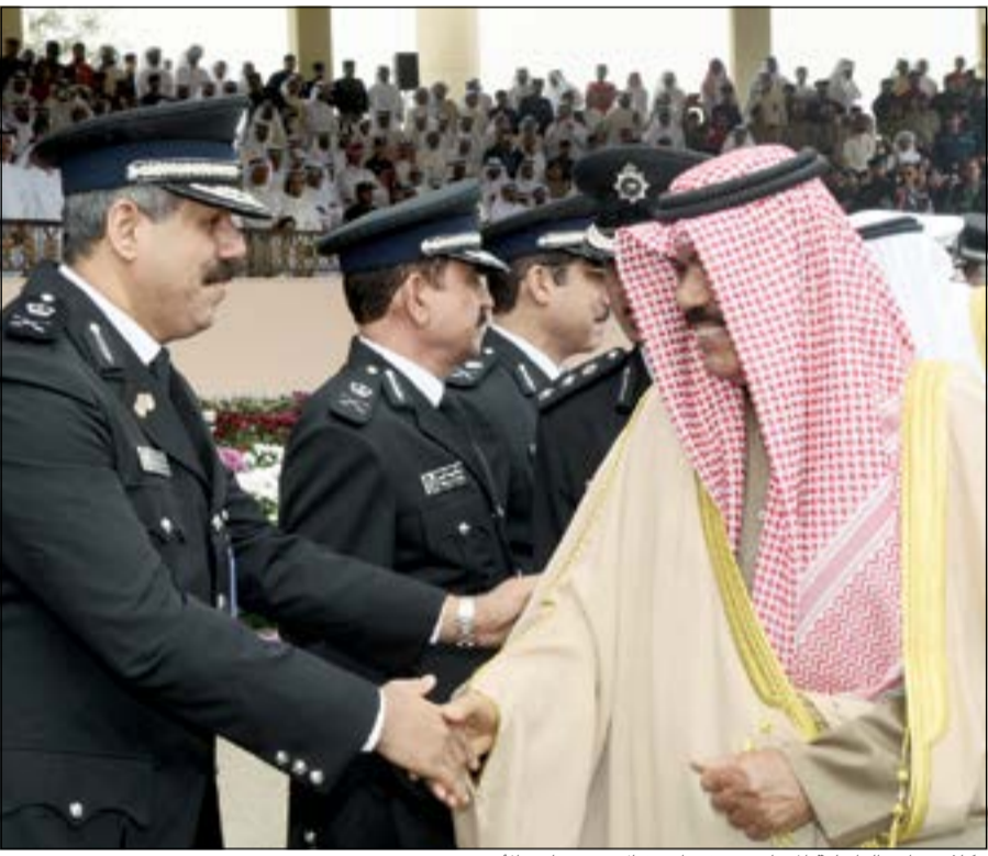
وكلاء وزارة الداخلية المساعدون في استقبال سمو نائب الأمير