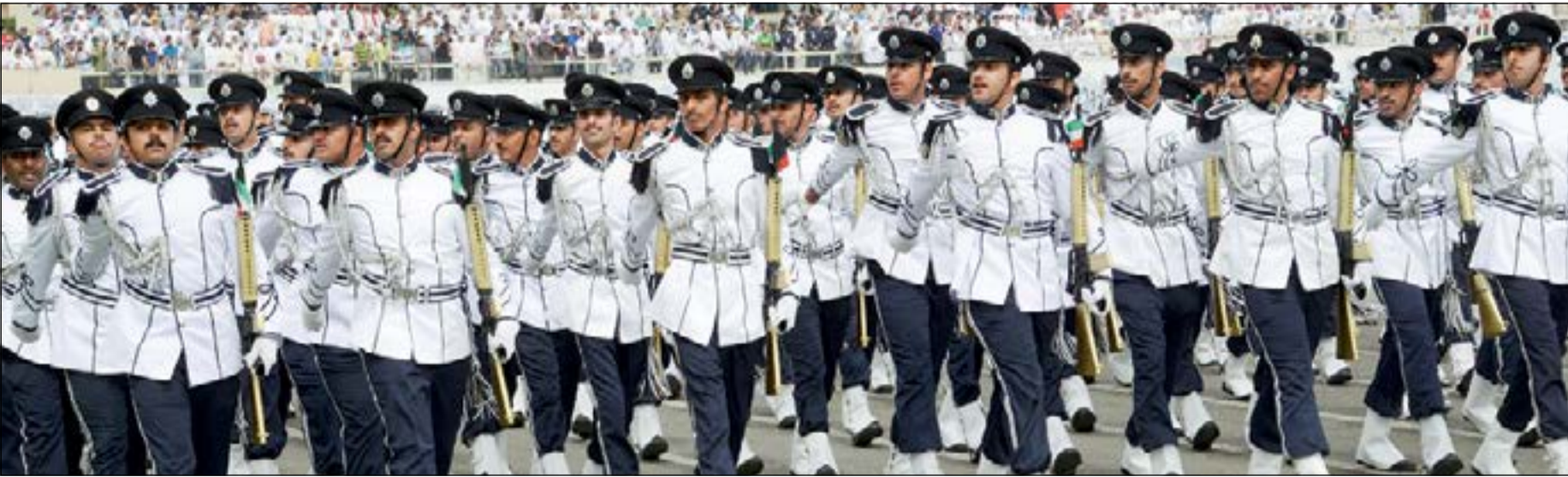
جانب من طابور العرض

اميركي تحت رعاية صاحب السمو الأمير الشيخ صباح الأحمد القائد الأعلى للقوات المسلحة وبحضور سمو نائب الأمير وولي العهد الشيخ نواف الأحمد، أقيم صباح امس حفل تخريج الدفعة 40 من الطلبة الضباط والدفعة 25 من الطلبة ضباط الاختصاص والدفعة 6 من طالبات الاختصاص بمعهد الهيئة المساندة وذلك في ميدان اكااديمية سعد العبدالله للعلوم الامنية. ووصل موكب سمو نائب الأمير وولي العهد الى مكان الحفل، حيث استقبل بكل حفاوة وترحيب من قبل كل من نائب رئيس مجلس الوزراء وزير الداخلية الشيخ محمد خالد ووكيل وزارة الداخلية الفريق