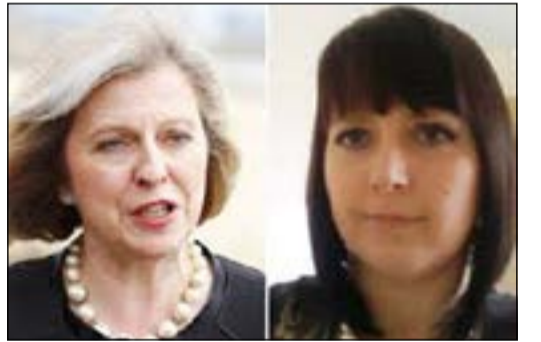
تريزا مي وكليز وود ضحايا العنف الأسري

وكالات: دشن البريطانيون خطوة غير مسبوقة في الحرب ضد العنف الأسري بإطلاق مبادرة في إنجلترا وويلز تتضمن المطالبة بقانون يسمح بالاستعلام من الشرطة عن شريك الحياة، وما إذا كان له سجل في ممارسة العنف الأسري أم لا. من المقرر أن يسمح مشروع القانون البريطاني للكشف عن سجل العنف الأسري، المعروف بقانون كليز، ومعلومات قد تجنب البريطانيين من أن يقعوا ضحايا للعنف، وانطلقت المبادرة السبت بالتزامن مع اليوم العالمي للمرأة في أعقاب إطلاق مشروعات قوانين تجريبية في أربع مناطق تتضمن مانشستر الكبرى، وجويت (ويلز)، ونوتنغهامشاير، وويلتشاير.