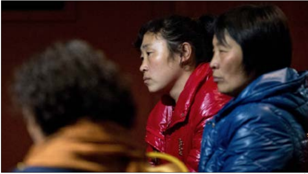
المساء على وجه شاب وفتاة ولا يزال اللغز قائما

أتلانتا - سي.ان.ان: ضربت هزة أرضية عنيفة بقوة 6,9 درجات على مقياس ريختر قبالة سواحل شمال كاليفورنيا فجر الاثنين. وقال مركز المسح الجيولوجي الأميركي، إن مركزا يقع على 50 ميلا غرب إيروكا في المحيط الباسفيك. وذكر «مركز الباسفيك للتحذير المبكر من تسونامي» إنه لم يصدر تحذيرا من أمواج مد عاتية قد تنجم عن جراء الهزة القوية. كما لم تظهر تقارير فورية عن سقوط ضحايا أو أضرار.