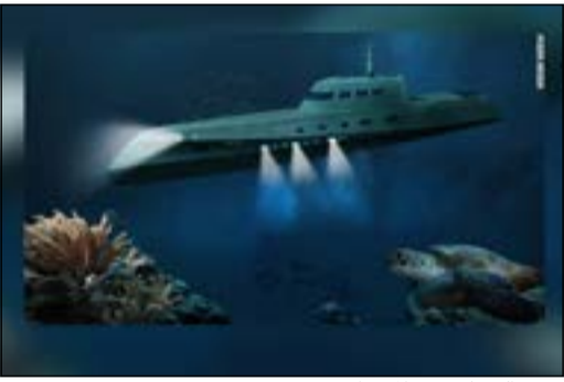
فندق العشاق في «المحيط»

نيسي - وكالات: هل فكرت يوماً ما في خدمة جديدة من نوعها تتيح للعشاق الذين يرغبون في الحصول على الشعور بالآثار في غرف رومانسية، أن يصلوا على هذا الشعور أيضاً وهم في أعماق المحيط؟ هذا بالتحديد ما تقدمه شركة «أوليفر لرحلات السفر» الفاخرة في أحدث عروضها. أما الخدمة الجديدة للحصول على الشعور بالمتعة فتستهدف الأزواج والعشاق، الذين يسعون للإثارة الحسية تحت الماء في غواصة خاصة تلقب باسم «لوفرز ديب» أو «عشاق الأعماق». أما قضاء العطلة المتكررة، في الغواصة الراسية في منطقة البحر الكاريبي، فقد تم إطلاقها من قبل الشركة البريطانية للسفر للاحتفال بالذكرى السنوية العاشرة لإنشائها. وقال مؤسس «أوليفر لرحلات السفر»، أوليفر بيل: «لقد بدأنا في العمل منذ 10 سنوات مع التركيز على القصور الفرنسية في البداية، ولكن أطلقنا أوليفر ترافل في نوفمبر، والتركيز يجري حالياً على خصائص فريدة من نوعها»، مضيفاً أنه «من أجل بث الحياة في علامة تجارية جديدة، احتجنا إلى الحصول على بعض أفكار الملكية الاستثنائية».