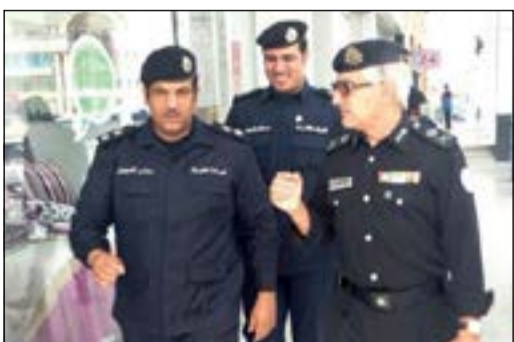
اللواء إبراهيم الطراح خلال حملة المفاهي