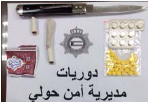
المطواة والحبوب والمواد المخدرة المضبوطة

الا انه رفض وقاوم رجال الامن وكذلك الفتاة، حيث تم طلب اسناد، وباخضاع الفتاة والشاب للتفتيش عثر بحوزتهما على 32 حبة صفراء و 10 حبات بيضاء ومطواة وادوات تعاطي وعلبة صغيرة يرجح ان بها مادة مخدرة وسجائر بها حشيش، هذا وتم اخطار مدير امن حولي والذي امر بتسجيل قضية بحق المدعى عليهما قبل احالتهما الى الادارة العامة لمكافحة المخدرات.