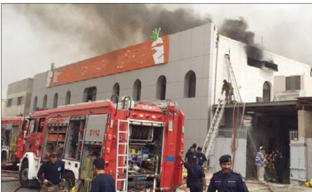
مراكز سيطرت على الحريق في وقت قياسي