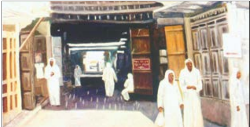
لوحة تراثية للأسواق القديمة