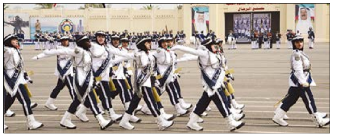
استعراض للدفعه 6 من الهيئة المساندة

نائب الأمير شهد تخريج الدفعة الـ 40 من الطلبة الضباط والدفعه 25 من ضباط الاختصاص والدفعه 6 من الهيئة المساندة 48 49