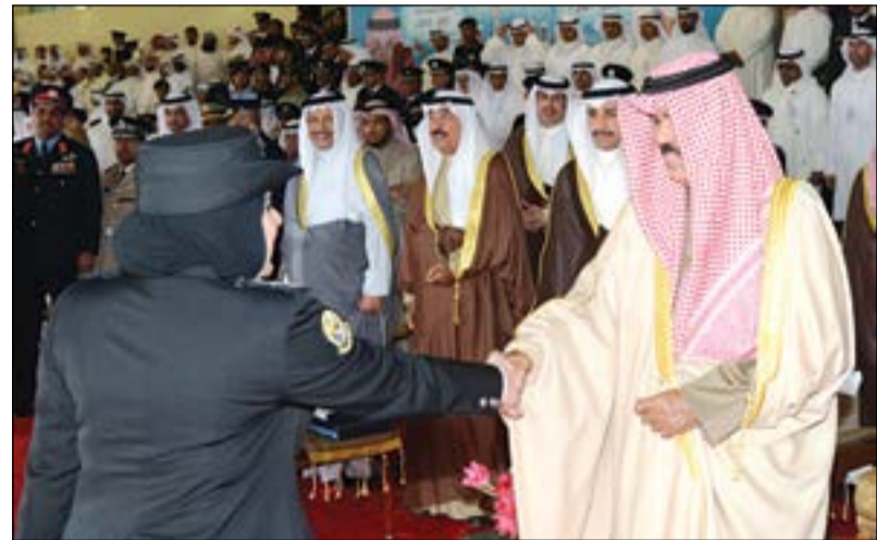
سمو نائب الأمير وولي العهد الشيخ نواف الأحمد مكرما إحدى الخريجات

نائب الأمير شهد تخريج الدفعة الـ 40 من الطلبة الضباط والدفعه 25 من ضباط الاختصاص والدفعه 6 من الهيئة المساندة 48 49