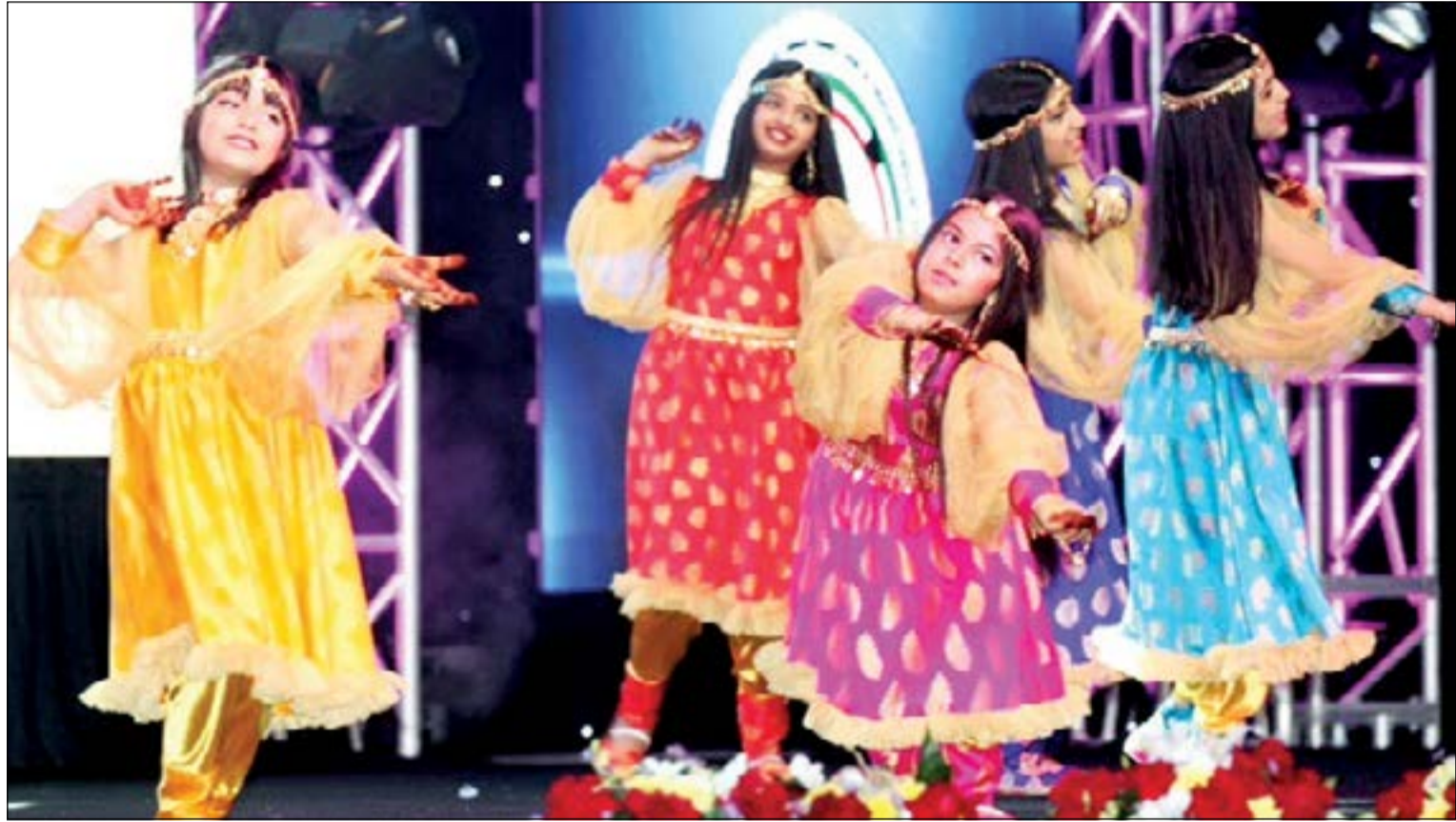
عرض مميز للطلبات في الافتتاح

أكد وزير الاعلام ووزير الدولة لشؤون الشباب الشيخ سلمان الحمود ان دعم صاحب السمو الأمير الشيخ صباح الاحمد لرياضة الرماية الكويتية يعد وسام فخر واعتزاز لمنتسبي اللعبة. جاء ذلك عقب حفل افتتاح بطولة سمو الأمير الدولية السنوية الكبرى الثالثة للرماية الذي اقيم اول من امس على مجمع ميادين الشيخ صباح الاحمد الاولمبي للرماية والتي تشمل اقامة ثلاث بطولات هي بطولة سمو الأمير لأسلحة الخرطوش (سكيت - تراب - ديل تراب) والبطولة الآسيوية السابعة للمسدس والبنديقية و بطولة «سبورتنج».