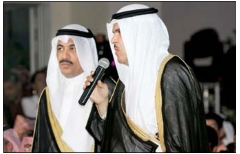
ممثل صاحب السمو وزير الإعلام والشباب الشيخ سلمان الحمود يفتتح البطولة وبجانبه دمج العتيبي