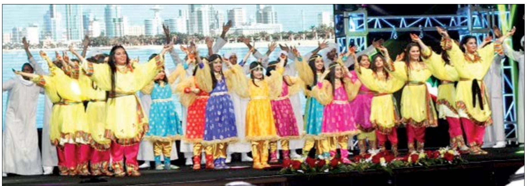
عرض مميز لأوبريت «حب الوطن» في افتتاح البطولة العالمية