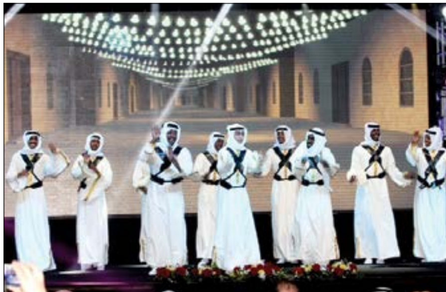
فكرة تراثية نالت استحسان الحضور

وقال العتيبي في كلمته التي ألقاها في حفل الافتتاح «أن مآثر سمو الأمير علي رياضة الرماية الكويتية متعددة ومنها إنشاء مجمع رياضي أولمبي قريب من نوعه وتتوافر فيه جميع مستلزمات اللعبة ليصبح