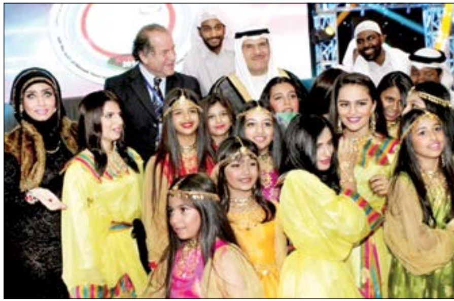
الحمود مع عدد من الزهراء والمسؤولين الكبار في الرماية

وشكر «بورلا» كل من سائده خلال الفترة التي سبقت المشاركة في بطولة قطر، متمنيا ان يحالفه التوفيق في المسابقات المقبلة لتمثيل البلاد بالصورة المأمولة ووسط منافسة قوية من المتسابقين من الدول الأخرى.