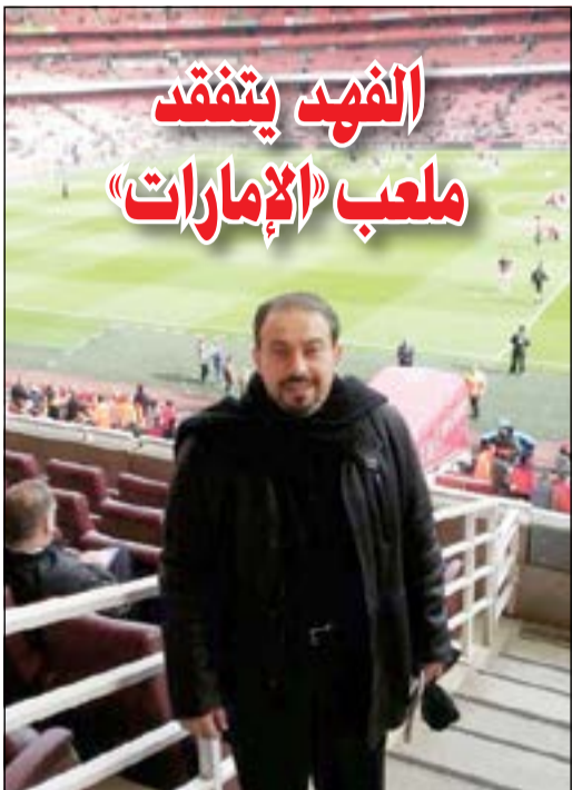
الشيخ د. طلال الفهد في ملعب أرسنال

كشفت صحيفة «صنداي تلغراف» البريطانية، عن اعتزام إدارة باريس سان جرمان الفرنسي تقديم عرض مالي كبير تتجاوز قيمته الـ 40 مليون استرليني من أجل الحصول على خدمات البرازيلي أوسكار نجم خط وسط تشلسي الإنجليزي. وأكد جيبسون بيرت وكيل أعمال الدولي البرازيلي، اهتمام سان جرمان بضم موكله، بجانب كل من برشلونة الإسباني وموناكو الفرنسي، ولكنه أشار إلى أن أوسكار لا يزال يملك 3 سنوات في عقده مع «البلوز»، وانتقاله في هذا التوقيت سيحتاج لتغيير العديد من الأمور التي تخص اللاعب وناديه.