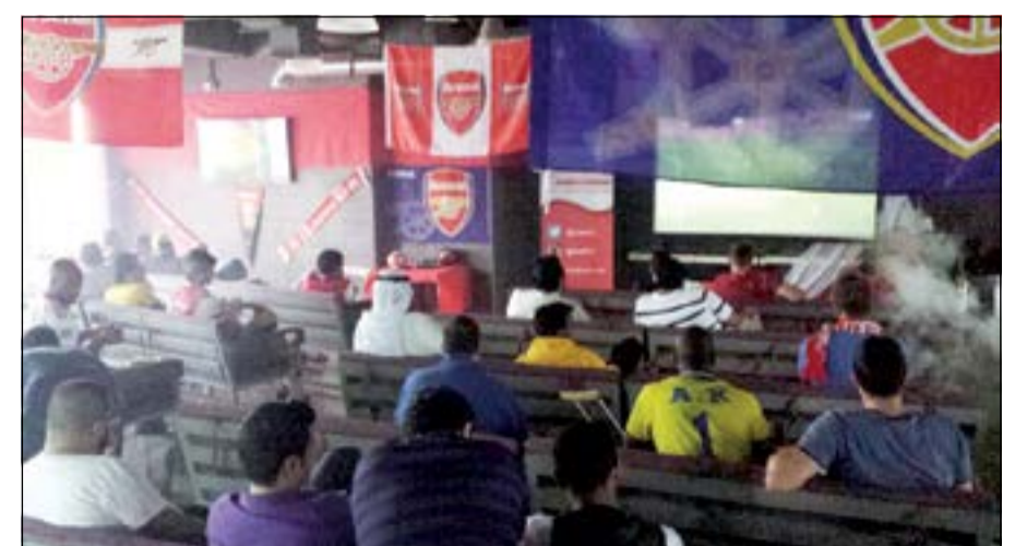
لسان حال الرابطة: «معك يا أرسنال دائماً»