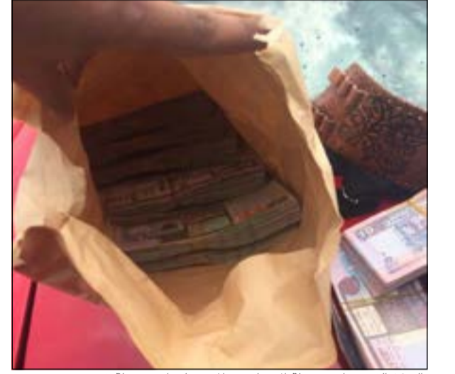
الـ 26 ألف دينار حصيلة الاتجار في المنوعات ام حصيلة قرض؟

أحالت الإدارة العامة بالنجدة عسكريا في وزارة الدفاع وطالبا مبتعثا في الولايات المتحدة كان قد عاد لقضاء عطلة بين أهله، بعد أن تم العثور بحوزتهما على