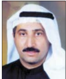
المستشار نجيب الملا

وكلفت المحكمة النيابة العامة بعرض ملف القضية على محكمة الاستئناف العليا خلال شهر من تاريخ صدور الحكم، بينما برأت المحكمة المتهم الخامس (صديق المجني عليه) من تهمة تبادل الضرب مع المتهمين الأربعة.