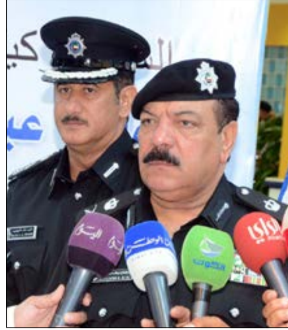
اللواء عبدالفتاح العلي يتحدث للصحافيين

التعاون لدول الخليج العربية، ويرسخ وحدة الأهداف التي تسعى إليها من أجل إيجاد حلول علمية وجذرية للقضية المرورية.