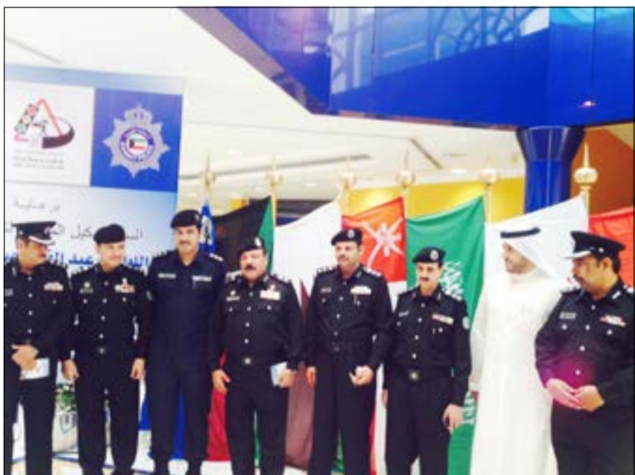
قيادات المرور شاركت في حفل الافتتاح

اصعب مواطن شاب إلى مستشفى العبدان للعلاج من اصابات لحقت به جراء انقلاب مركبته التي كان يقودها مقابل منطقة ميناء عبدالله، وقال مصدر أمني ان رجال الامن سبلوا للمواطن المصاب مخالفة مرورية وهي قيادة مركبة من دون لوحات.