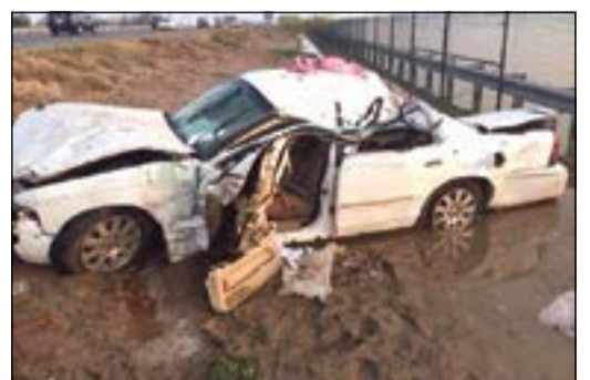
السيارة وقد تعرضت لتلفيات جسيمة