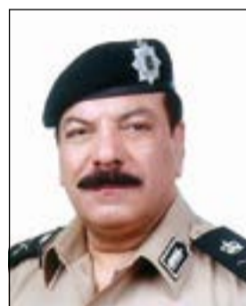
اللواء عبدالفتاح العلي

كما قامت فرقة المهام بالفحص الفني لعدد 325 مركبة والقيام بعدد 40 أمر